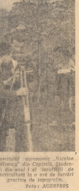
Institutul agronomic „Nicolae Bălcescu” din Capitală. Studenții din anul I al facultății de horticultură la o oră de lucrări practice de topografie.

milioane. Noi nu vom înșela. Vom arăta numai că sursele elementare sau baterii solare din materiale semiconductoare pot transforma energia radiantă în energie electrică. În ce condiții are loc această transformare? Randamentul teoretic, atunci cînd se utilizează drept material semiconductor siliciul, se ridică la 25 la sută, ceea ce reprezintă destul de puțin. Este știut că fotonelele de energie electrică mai ales partea vizibilă a radiației solare. Alte fotonelele semiconductoare — cele cu telurură de cadmiu sau cu fosforă de indiu — ar trebui să poată atinge un randament teoretic de 25 la sută. Radiația solară conține însă și raze ultraviolete și raze infraroșii, care ar fi bine să fie de asemenea utilizate. S-au propus, în acest scop, soluții ca, de pildă, crearea unor baterii solare din straturi semiconductoare stratificate. Fiecare din aceste straturi fiind sensibilă la una din componentele radiației solare. Acțiunea lor conjunctă ar putea duce la un randament teoretic, pînă la 40 la sută.