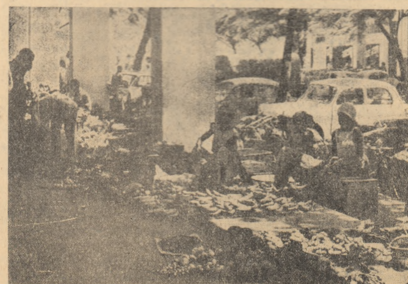
BRAZZAVILLE: Aspect de pe una din străzile orașului

Politicienii de la Salisbury caută febril ieșiri. Singurii care-i încurajează sînt liderii sud-africani a căror proprie izolare pe arena mondială se accentuează. La Pretoria și la Salisbury se pun în circulație idei de salutare a