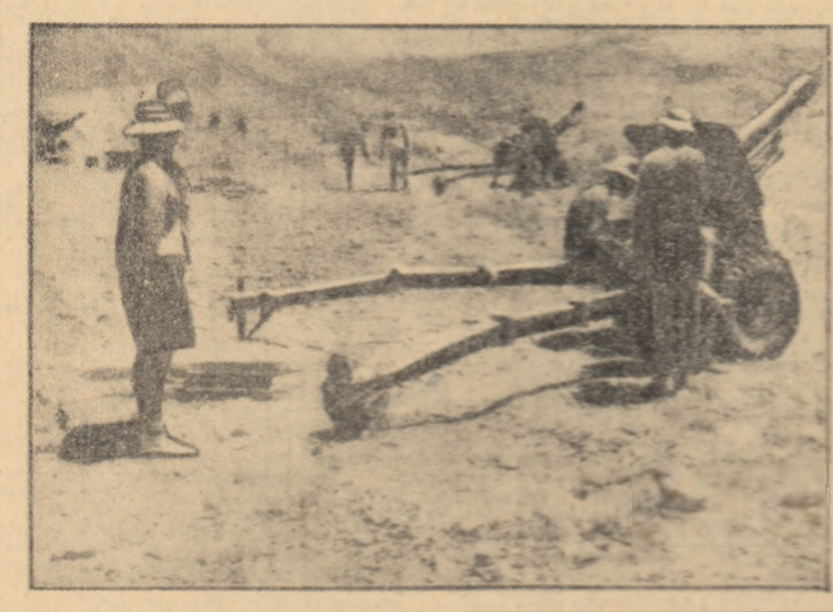
Artileria britanică în acțiune în Aden

Deși la alegerile preliminare pentru candidații Partidului democrat nu a fost trecut nici un nume în statul Nebraska, președintele Johnson a primit în aceste state tradițional republican, peste 50.000 de voturi, numai ca 10.000 voturi mai puțin decît Goldwater.