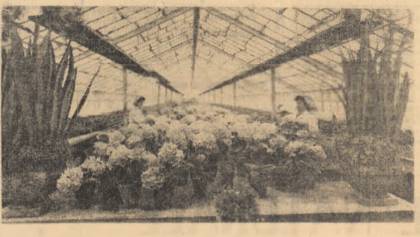
Aspect din sera de flori a G.A.S. Popesuli, regiunea București.

lorificarea energiei apelor, a vînturilor sau despre exploatarea mai deplină a cărbunilor și ștețurilor. Se pune problema de a se renunța pur și simplu la acești „intermediari”. Oamenii de știință vor pentru a le folosi, s-au creat încă în secolul trecut. În 1878 un inginer francez a reușit să obțină aburi cu ajutorul razelor de soare. Se cunosc așa numitele „lăzi fierbinți” care, captînd razele solare, încălzesc apa la temperatura destul de ridicată. Încălzirea de acest gen sînt folosite, în lume, pentru băile publice, spălătorii, fabrici de conserve etc. Tehnica a progresat, cu timpul, ajungîndu-se chiar la proiectarea unor centrale electrice solare. Problema esențială este însă alta: aceea a transformării directe a energiei radiante în energie electrică. În acest sens, cele mai mari speranțe ale oamenilor de știință sînt legate de tehnica semiconductoarelor. S-a vorbit mult despre acestia, despre însușirile lor u-