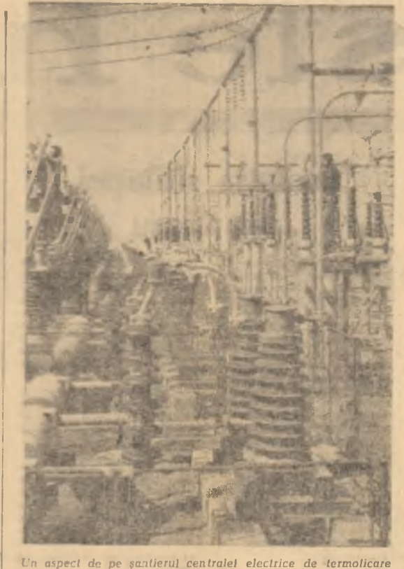
Un aspect de pe șantierul centralei electrice de termocărbune de la Craiova.