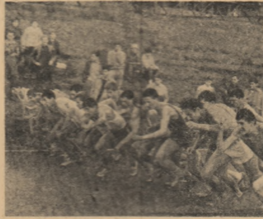
Start la proba de 3000 m plat