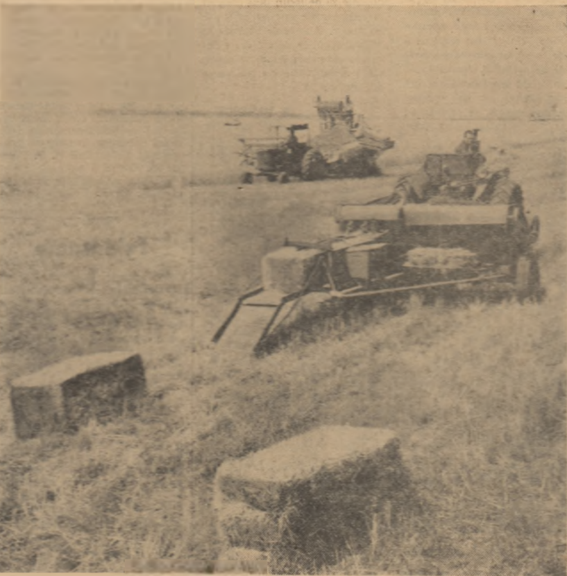
Pe ogoarele G.A.C. Fărdălea. În urma combinelelor, presele de balot strîng paie în baloți creînd cîmp liber pentru electuarea arăturilor și înălmîntării culturilor duble.