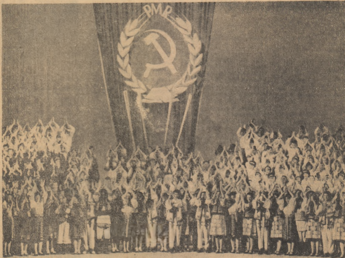
Moment din spectacolul de gala prezentat de formațiile artistice premiate la concursul pe țară al pionierilor și elevilor