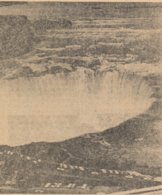
Fluvul Niagara din America de Nord (secțiune din Saint Laurent — St. Laurentiu) — seprind Canada de Statele Unite și unind Lacul Erie de Lacul Ontario — este cunoscut prin viziuta cataractă denumită Cascada Niagara, înaltă de 50 de metri. Cascada Niagara cuprinde două cataracte: (Cascada Americană și Cascada Horseshoe). În fotografie — Vedere a cascadei (Horseshoe) luată de pe un turn de observație.

WASHINGTON. — Maxwell Taylor, ambasadorul S.U.A. la Saigon, a sosit luni la Washington pentru a avea consul-