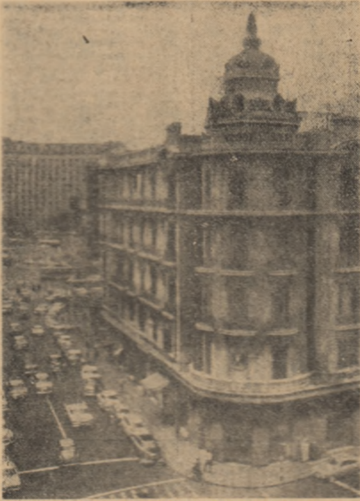
R.A.U.: Imagine de pe tîna din strălucirea orașului Cairo

Răspunzînd opoziției care a cerut ca actualul guvern să fie transformat într-un gu-vern al unității naționale, Imoulu a declarat: „Eu cred că această problemă nu poate fi reglementată în cursul ac-tualelor dezbateri generale”.