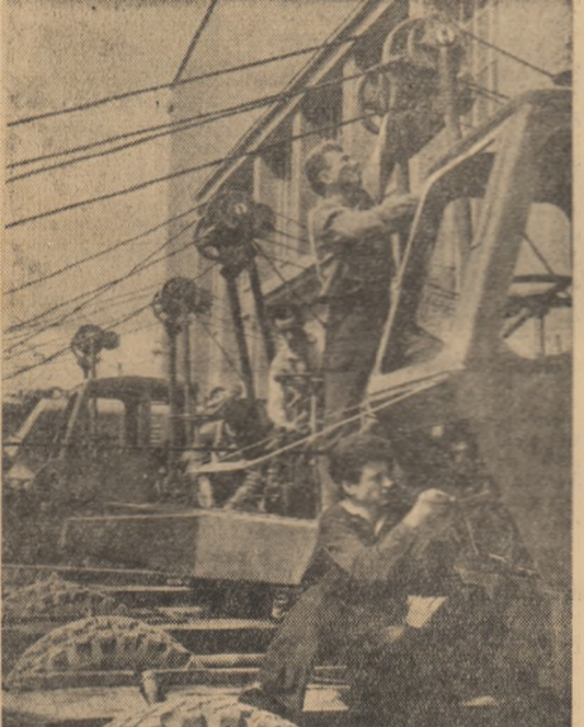
Usina „Progresul” — Brăila este cunoscută pe șantierele patriei pentru calitatea agregatelor care se execută aici. În fotografie, clișia tineri din colectivul ce lucrează la excavarea de 0,3 m.c.

Pe scena Operei Balada coregrafică „Iancu Jianu”