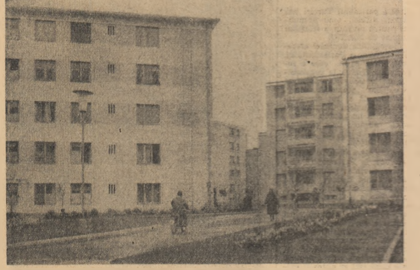
Noi construcții de locuințe în cartierul Libertății din orașul Turda

Marți seara, la Budapesta, în cadrul campionatului european feminin de baschet, echipa R.P. Romine a reușit o frumoasă și netă victorie în fața reprezentativei R.P. Ungare, cu scorul de 53-42 (25-13). În urma acestui succes, baschetbalistele romine și-au sporit șansele de a se califica în semifinalele campionatului. Alte rezultate înregistrate ieri: U.R.S.S. — Franța 71-34 (30-16); R. S. Cehoslovacă-R. P. Polonă 47-31 (21-18). Astăzi, echipa R. P. Romine înfrîngește formația U.R.S.S., iar mine pe cea a R.S.F. Iugoslavia.