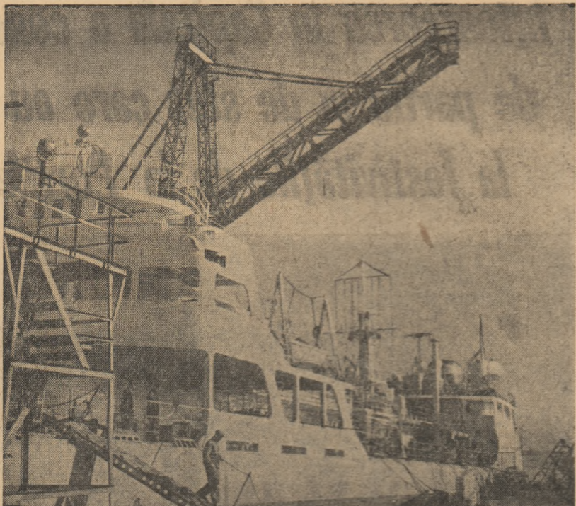
Șantierul de construcții navale „Gheorghe Dimitrov” din orașul Varna

De ziua marilor sărbători a Bulgariei frățestre, adresăm poporului și tineretului bulgar un călduros salut și urarea de a obține noi succese pe drumul socialismului și apărarea păcii.