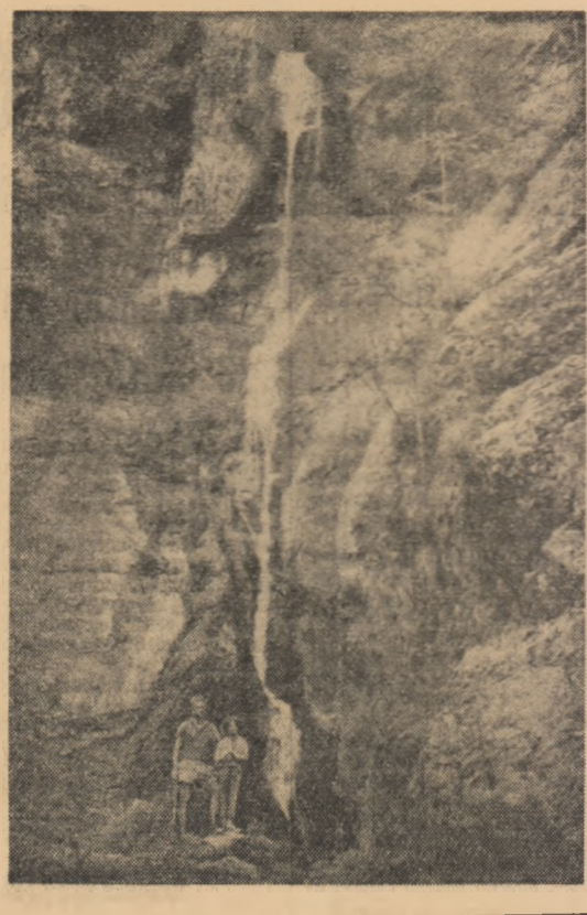
In Munții Cosiel. Cascada de sub Incalzitorile Foartele