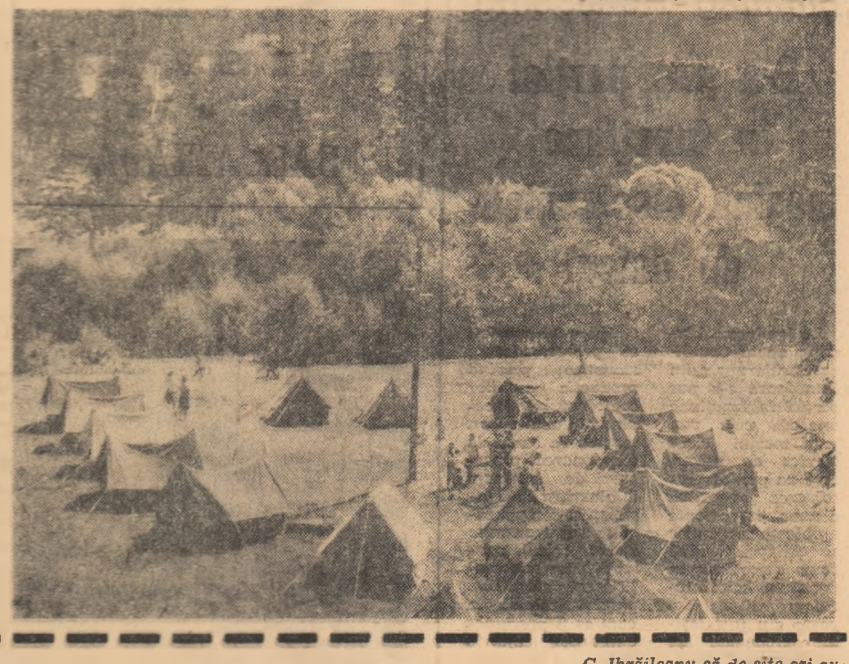
Tablouri de corturi organizate de O.N.T. Curpaș... Tablouri de corturi organizate de O.N.T. Curpaș...