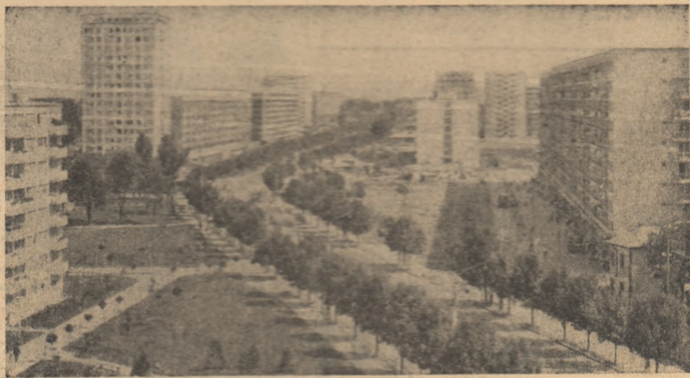
Noul cartier de locuințe, Șoseaua Giurgiului din Capitală

Pag. a III-a Bună dimineața, școală! Pag. a V-a BALCANIADA