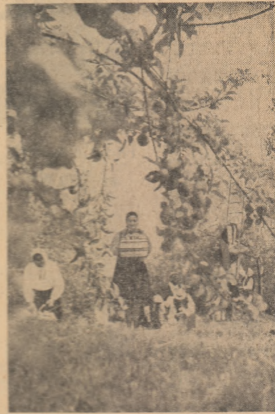
Cultural mercur la G.A.C. Săpînța, raionul Sighet