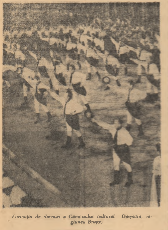
Formația de dansuri a Căminului cultural „Dășoara”...