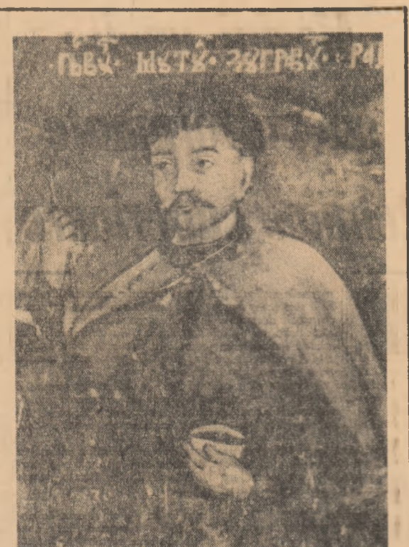
Autopretul al pictorului Pîru Mutu (sec. XVII)

În primele decenii ale sec. al XIX-lea vom avea — ca urmare a împrejurărilor mai sus amintite — unii pictori de por-