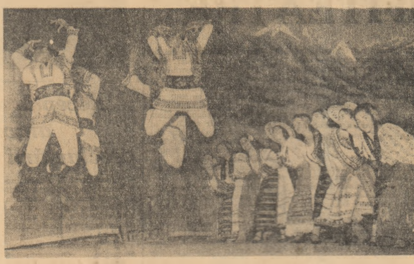
Din spectacolul Ansamblului folcloric „Fetele”