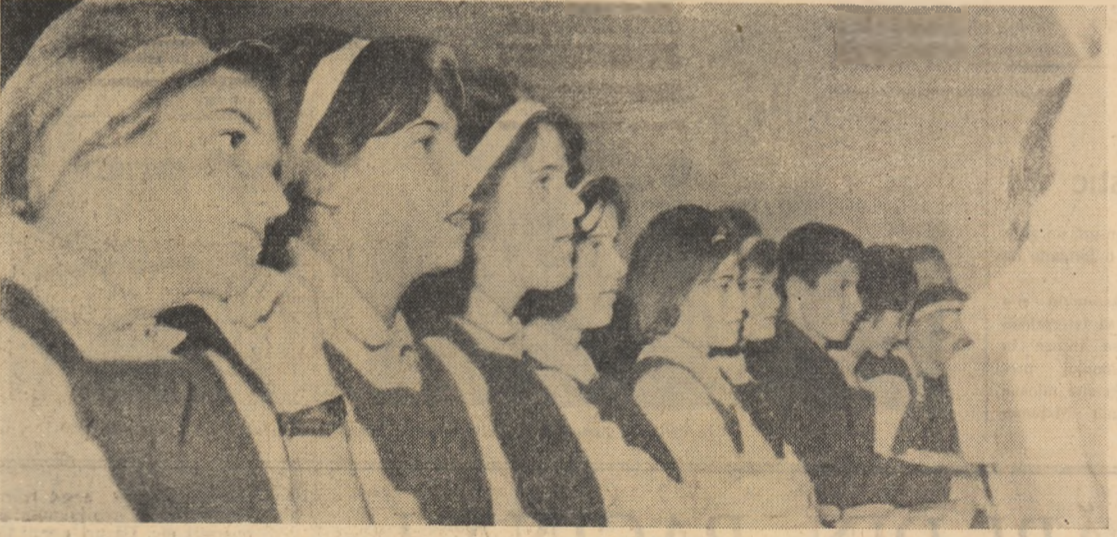
„Da, aveți dreptate. La viitoarea profesie trebuie să ne gândim cu chibzuință. Așa vom face” par a spune, participanții la discuția despre „Năzuințe și idealuri”.

București Sînt plăcut impresionat de călduroasele felicitări și urări de tinerie și prosperitate pe care le-ați formulat în mesajul ce ați binevoit să mi-l adresați cu ocazia celei de a 10-a aniversări. Feriți-mi. Excelență, să adresez în numele poporului și guvernului algerian și în numele mea personal, mulțumirile noastre cele mai vă poporului român prieten și Dumnezeu voastră personală urări de bine și sănătate. Sînt sigur că cooperarea internațională, chemată a unei mai bune înțelegeri între oameni, va contribui în mare măsură la eliminarea nedreptății și a tuturor formelor de inegalitate. Cu încredere, AHMED BEN BELLA, Președintele Republicii Algeriene Democratice și Populare