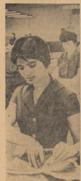
In sala de croit a Fabricii de blănuri „1 Mai” din Oradea.

Angajamentul anual privind realizarea de economii suplimentare la prețul de cost a fost îndeplinit și de lucrătorii din industria chimică a regiunii. Valoarea economiilor suplimentare la prețul de cost obținute de colectivele întreprinderilor regiunii Brașov se ridică la peste 86 milioane lei.