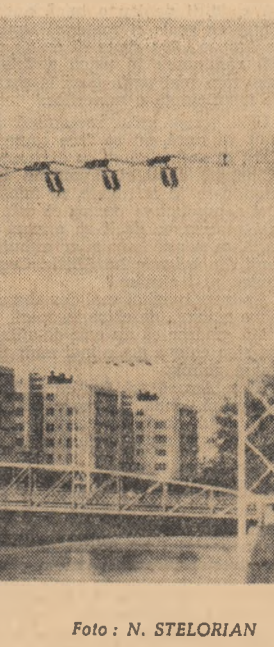
Cluj. Pe malul Someșului