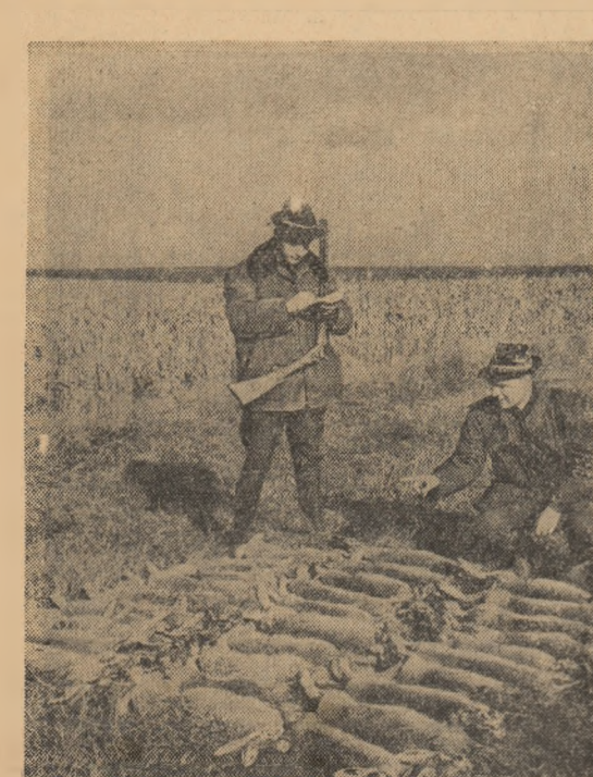
Nu e rău... (La o vîntoară de leșuri în regiunea Bucureștii organizată de AGVPS)

CARAMITRU: Încercând experiența pe care ți-o dau mediile cu contactul cu oamenii deosebiți creșterea de trei asemenea întâlniri. Prima m-a fascinat. Îl cunosc pe G. Călinescu, din tot ce a scris. Ii cunoașteam cum s-ar spune expresia spirituală, dinamica ideilor. Trebuie să adaug că l-am înțeles și acceptat treptat. Vizita pe care i-a făcut-o un colectiv al Teatrului național