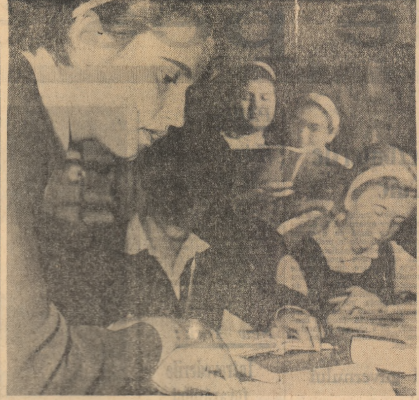
Elevi ai Școlii medii nr. 3 din Ploiești răsfoind curioși ultimele cărți și publicații sosite la bibliotecă