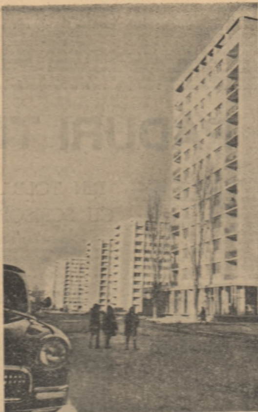
Nu! construcții de localitate De magnitudine nord-sud din Căminia

moderne în procesul de producție, precum și a numeroaselor îmbunătățiri aduse agregatelor de flotare care în majoritate sînt construite la noi în țară. Prin mărirea turajei morilor cu bile de la 24 la 27 ture pe minut, capacitatea de prelucrare a acestora a crescut în 24 de ore cu 20-25 tone mineru, iar datorită aplicării procedurii de flotare selectivă, cantitatea de mineru prelucrat a înregistrat o creștere de 20-30 la sută.