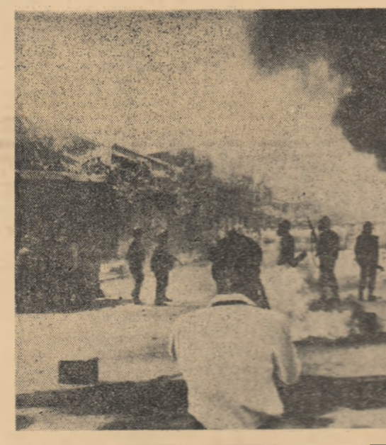
Vietnamul de nord. Unități militare repulși o demoraștrăie sălbatică deșertătoare în Saigon.

Memorandumul cuprinde, de asemenea, propuneri de a se ajunge la o înțelegere cu privire la distrugerea uniunii de bombardament, la interzicerea experiențelor subterane cu arma nucleară, la încheierea unui pact de neagresiune între statele participante la N.A.T.O. și la Tratatul de la Varșovia cu privire la adoptarea de măsuri în vederea printrimpinării unui atac prin surprindere și la reducerea efectivului total al trupelor statelor.