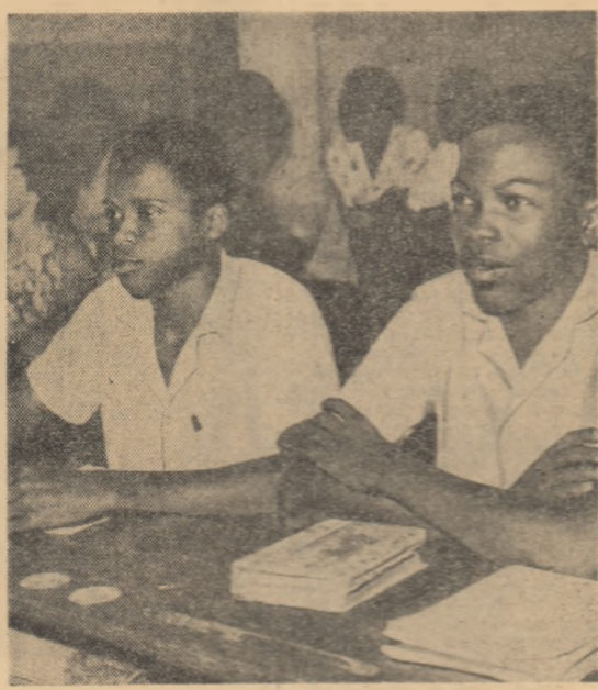
Republica Dahomey. Ora de curs la o școală.