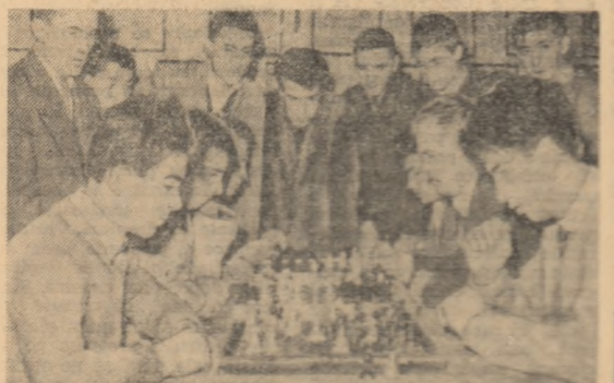
Intrețineri de săb, programate în cadrul primei etape a Spartachiadei de iarnă a tineretului...