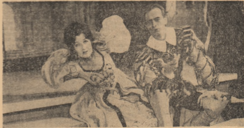
Pe scena Teatrului de stat Brăila „Femeia îndărătnică”

Miercuri seara, la Teatrul de Operă și Balet al R. P. Romine a avut loc premiara spectacolului „Prometeu” de Dora Popovici, interpretat după formula cu același nume a lui Victor Eftimiu și „Galileo Galilei” de Camilă Ceauș, adaptate după comedia scrisă de lui Bertold Brecht.