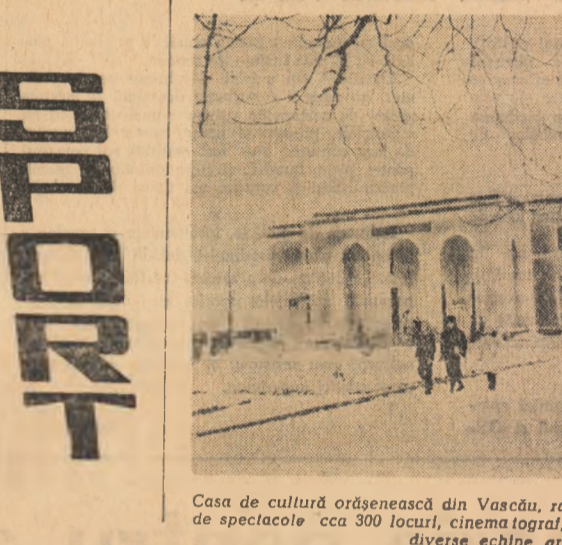
Casa de cultură ordșenească din Vaslui, raionul Beiuș, dispune de o sală de spectacole cca 300 locuri, cinema lograf, bibliotecă cu 10 000 volume și diverse echipe artistice