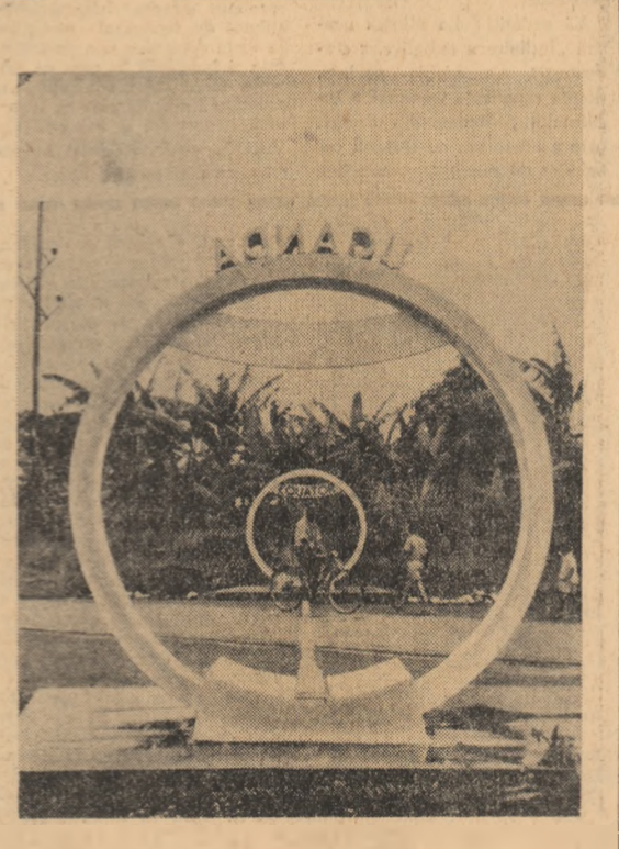
UGANDA: Borna, situată la 50 de mile sud de Kampala, capitala Ugandei, indicînd punctul de trecere al Ecuatorului prin Uganda

Apoi corespondentul postului de radio B.B.C., a vorbit