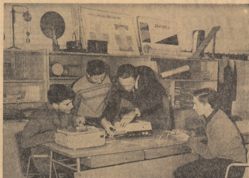
În R.S.F. Iugoslavia funcționează numeroase „cluburi ale tinerilor tehnicieni”. În fotografie: Aspect de la unul din aceste cluburi

Forța nucleară multilaterală are drept scop, după cum se afirmă în permanență în presa americană, o integrare militară păstrîndu-se dreptul de control al Statelor Unite. „Control final” — scrie ASSOCIATED PRESS — va continua să se afle în mijloc