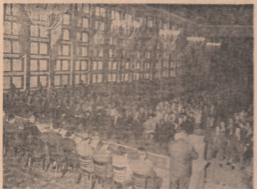
La adunarea din circumscripția electorală nr. 1 Pitești.