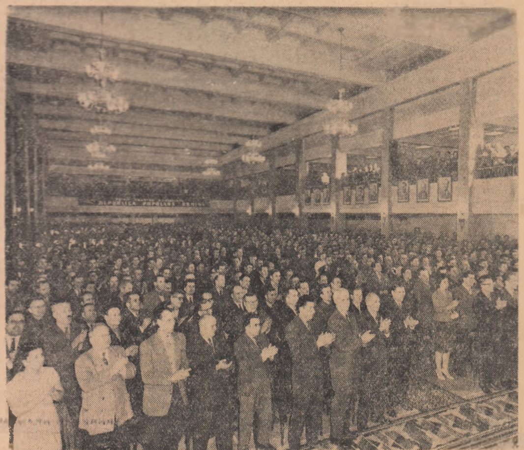
La adunarea din circumscripția electorală nr. 1 Grivița Roșie