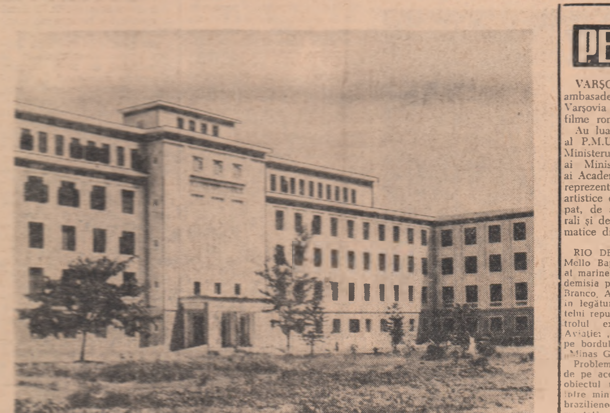
Clădirea Institutului de hidraulică din Hanoi, unul din noile centre de învățămînt superior din R. D. Vietnam