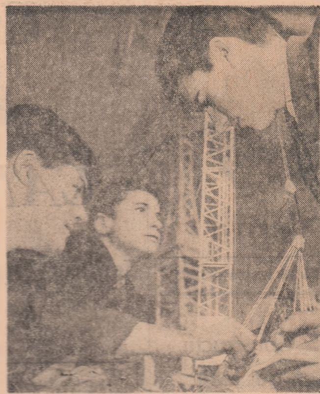
Elevii anului III mecanică utilaj de la Grupul școlar construcții-București minusele decamdată macaralele și utilajele miniaturale aflate în laboratorul școlii. În curînd, după absolvire, vor lucra la modernele utilaje de pe nenumăratele șantiere ale patriei