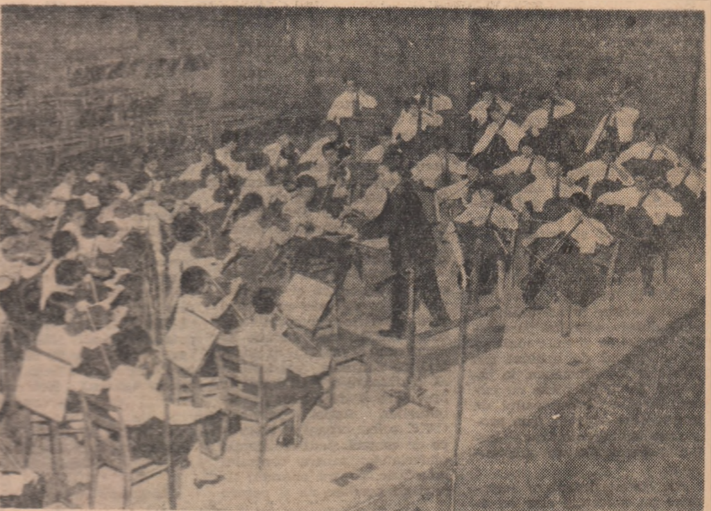
Orchestra simfonică de copii (amatori) din Russe