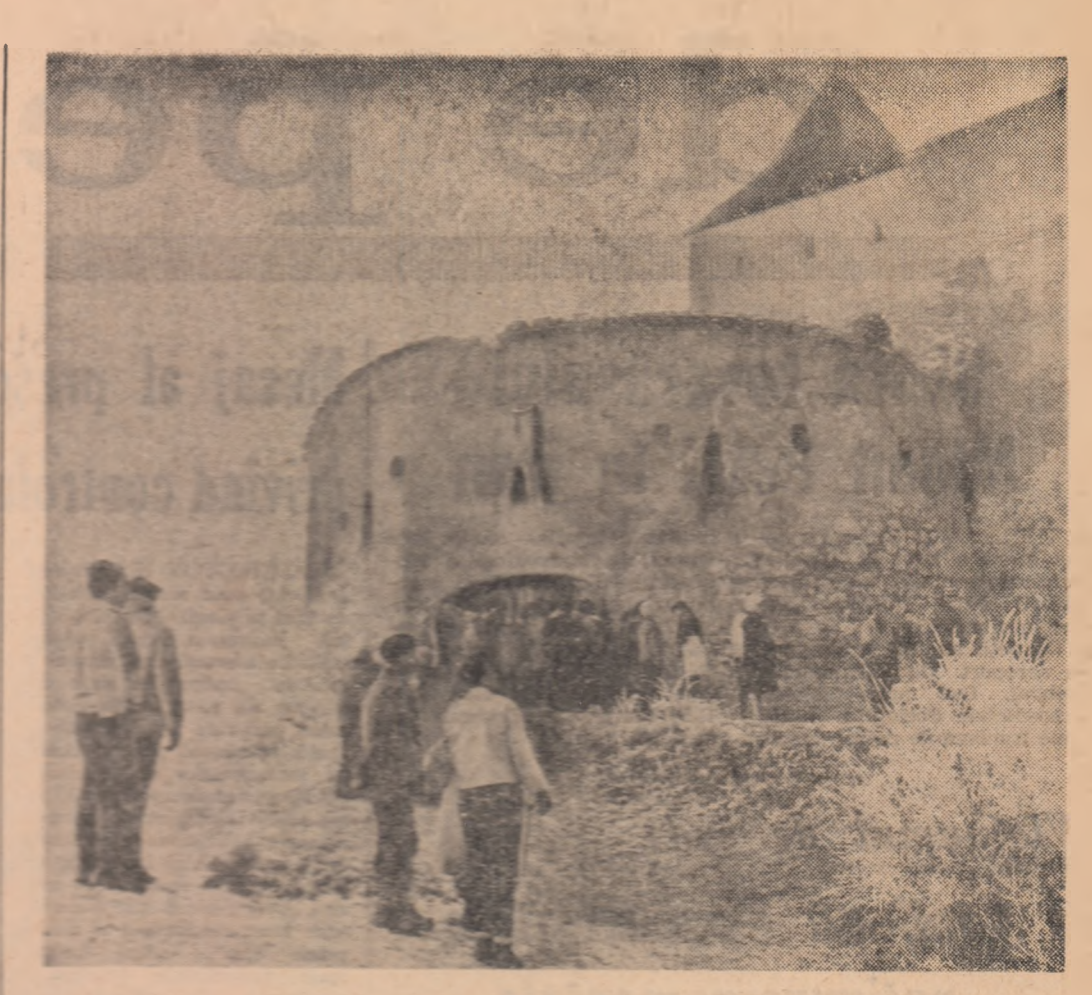
Ferivi în vizită la Cetatea Rîșnov

„În întreaga țară oamenii muncii au luat parte cu o înaltă încredințare, la stabilirea pentru democrația noastră candidatură pentru Frontul Democrației Populare în alegerile pentru Marea Adunare Națională”.