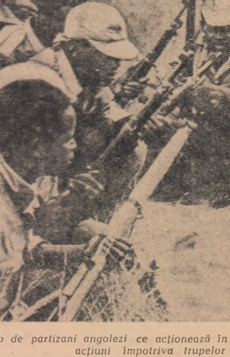
Un grup de partizani angolezi ce acționează în partea de nord a țării. Ei pregătesc noi acțiuni împotriva trupelor colonialiste portugheze

planului său privitor la învățămînt, prima etapă a unui plan de reformă agrară, construcția de locuințe și lărgirea serviciului sanitar. Puterile excepționale au fost cerute pentru a putea duce la îndeplinire o reformă a Băncii de stat și a administrației publice. Guvernul speră ca la alegerile parlamentare din 7 martie să obțină o majoritate, care să-i permită adoptarea proiectelor de reformă elaborate. Partidul guvernamental creștin-democrat intenționează să-și desfășoare campania electorală sub sloganul: „Congresul nu-l lasă pe Frei să guverneze”.