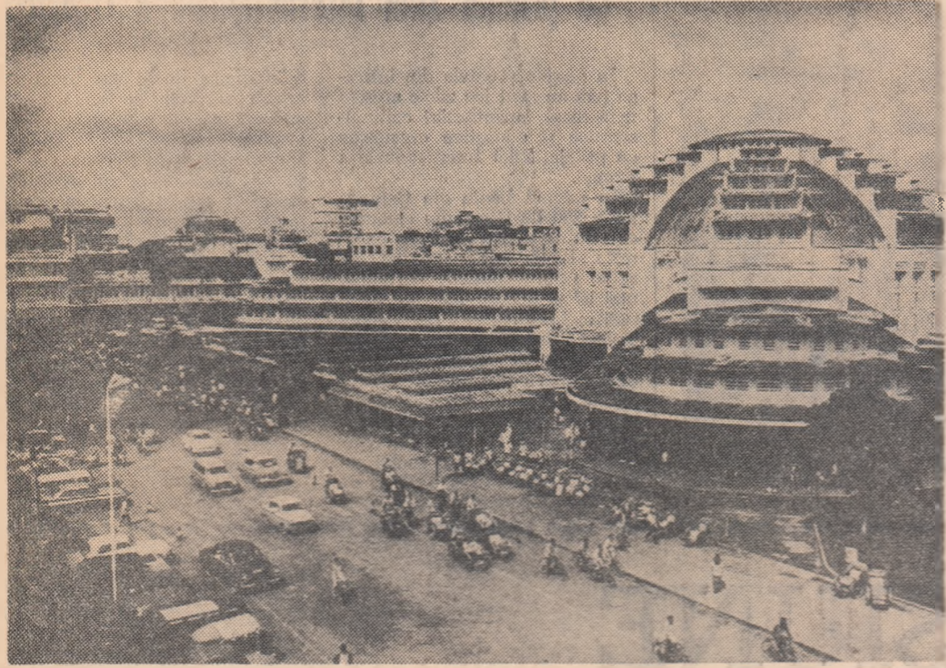
CAMBODGIA. Vedere parțială a Pieței centrale din capitala țării — Pnom Penh