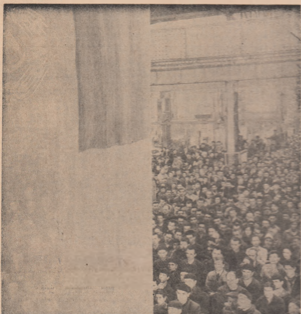
În liniștea grea a durerii, muncitorii Uzinelor „23 August” își simt sufletele unite de aceeași hotărîre: dăruirea forței și capacității lor creatoare operei de înflorire necontenită a patriei.