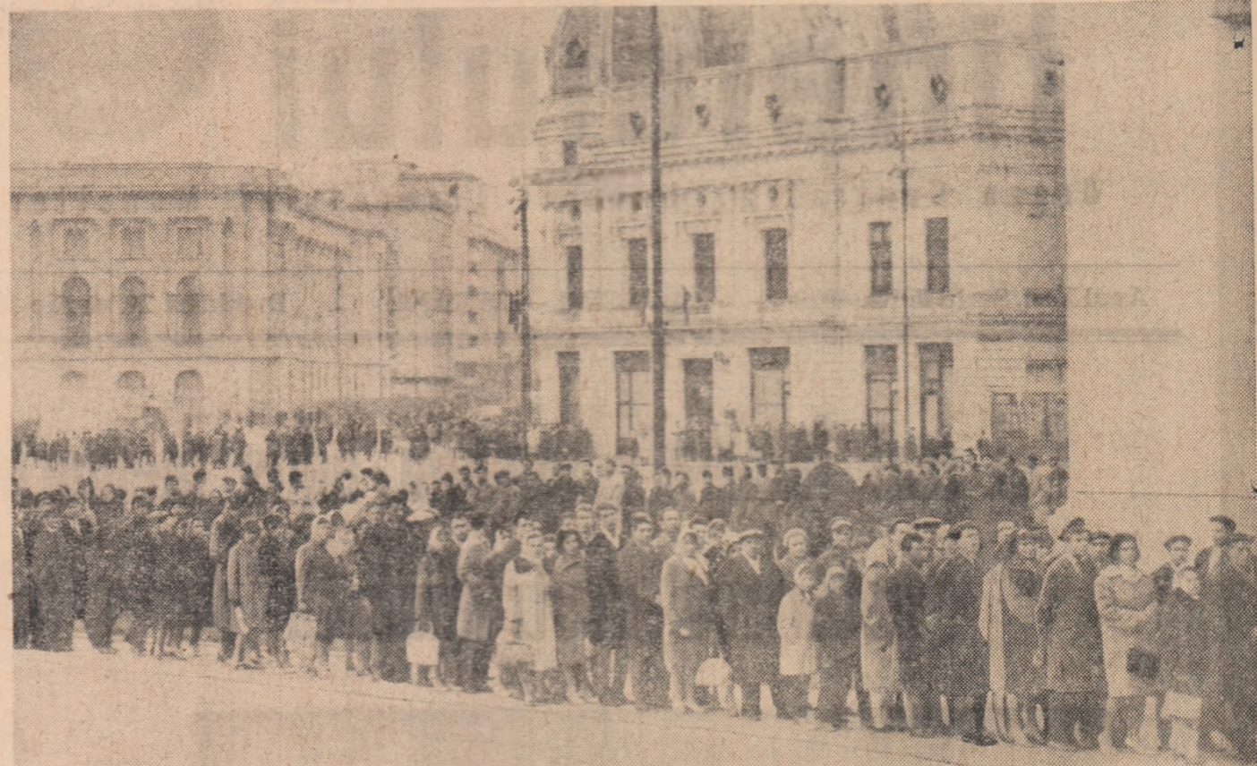
În pelerinaj la cabinetul de lucru al tovarășului Gheorghe Gheorghiu-Dej

La adunarea de doliu de la Uzinele „Tractorul” din Brașov, stăpînindu-și cu greu emoția, a vorbit maestrul Victor Oprea: „Parcă îl văd în anul 1951, cînd am prezentat la București primul tractor românesc pe șenile. Mă strîns atunci pentru prima dată mîna. Ne-am înțîlnit din nou cu prilejul prezentării primelor tractoare U-650, cînd faima tractorului românesc depășise de mult hotarele țării. Prin aplicarea indicațiilor extrem de valoroase date și cu acest prilej colectivul de muncă al uzinei noastre a reușit să realizeze la