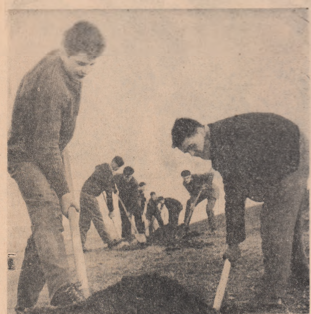
Odată cu venirea primăverii, organizațiile U.T.M. inițiază acțiuni de muncă patriotică la care tineretul participă cu entuziasm. Iată de tinerii de la Uzina de vagoane Arad, săpînd gropi pentru amenajarea unei plantații de pomi pe malul Mureșului.

comanda lui Ilarion Hipacioc. În condiții grele, pe o mare agitată, echipajul pilotajului românesc, cu ajutorul altor marinarilor portuali, prin intermediul Val Săvulescu și Gh. Popescu, a efectuat, într-un timp scurt, operațiunile de salvare a tuturor celorlalte echipajului navei au fost terminate. Într-un timp scurt, operațiunile de salvare a tuturor celorlalte echipajului navei au fost terminate.