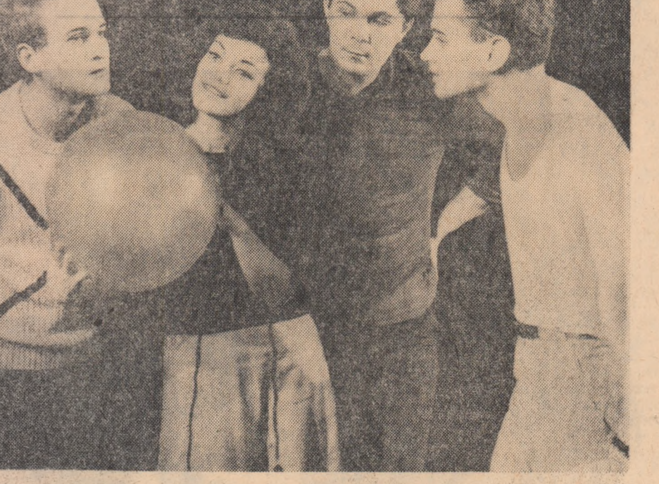
Studioul experimental al Teatrului „C. I. Nottara” prezintă în cadrul ciclului „Prietenii Studioului Experimental” trei povestiri de Oswald Dragun, în traducerea lui Romulus Vuiculescu. În fotografie: scenă din „Omul care s-a transformat în cîine”

Am reținat câteva aspecte ale activității pe care o desfășurăm în Institutul pentru pregătirea viitorilor ingineri. Scopul este să participăm la această discuție a șefilor de cadru, a specialiștilor și întreprinderilor care primesc studenții la practică și absolvenții. Părerile lor, experiența pe care o pot relate, observațiile critice și propunerile acestora ne pot fi de un real folos pentru perfecționarea procesului de pregătire teoretică și practică a viitorilor specialiști.