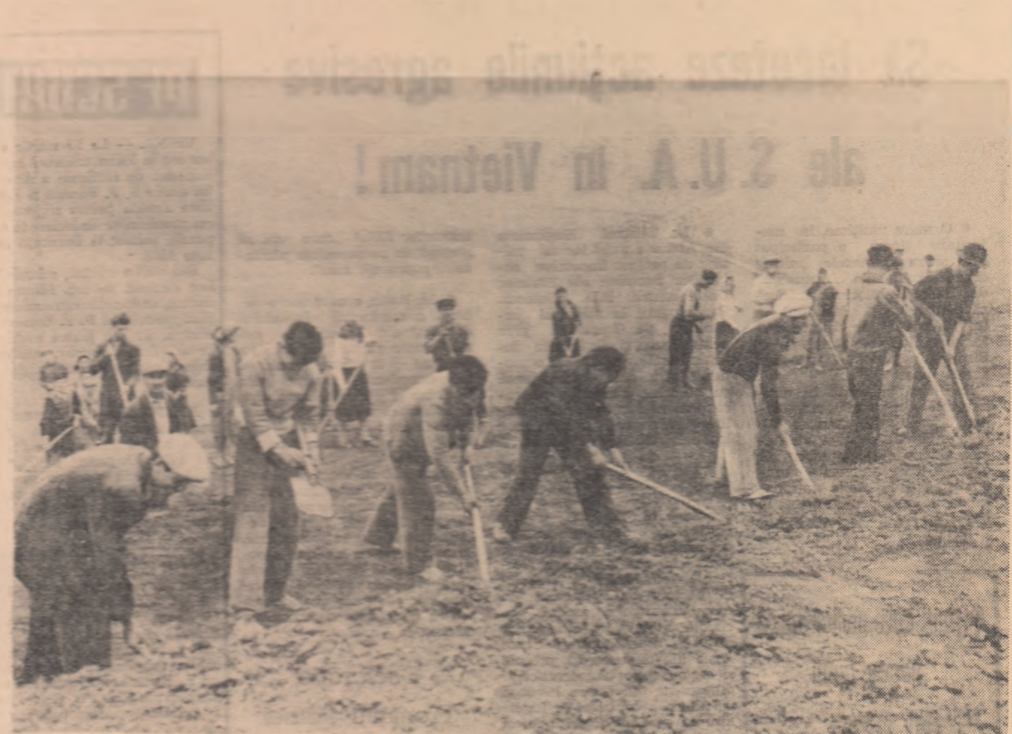
Ca în fiecare primăvară, îndată ce timpul s-a încălzit și s-a zvîntat pămîntul, tinerii au început acțiunile de muncă patriotică pentru întărirea pășunilor naturale.