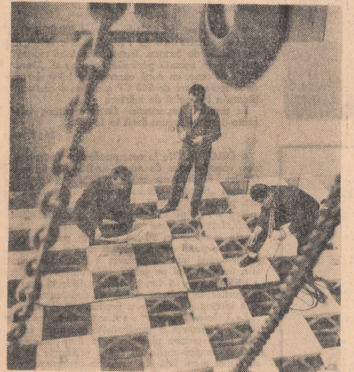
Colectivul laboratorului de încercări pe modele de la Institutul de cercetări în construcții și economia construcțiilor din Capitală a realizat un nou model de structură de rezistență pentru acoperișuri de hale industriale. În fotografie: o secvență de la încercările cu noul tip de acoperiș.