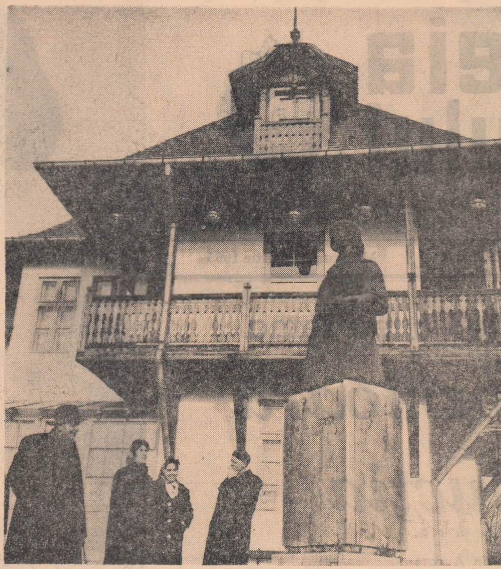
Numeroși vizitatori vin la Cimpina să vadă casa în care a trăit ultimii ani ai vechii, marele nostru pictor N. Grigorescu