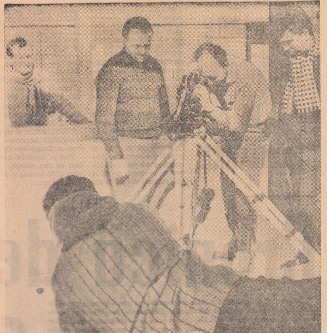
La Poiana Brașov. Se turnează un nou film artistic