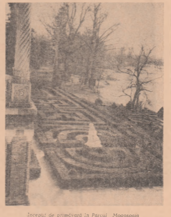
Început de primăvară în Parcul Mogoșoaia

El condamnă ferocitatea represunilor politice împotriva ereticilor, cauză lăsată în care sînt trimiși aceștia, sugerează contrastul dintre țara și conștientul de care se bucură pentru conducătorii albi și albiștri în care se zăbovește majoritatea africană a populației.