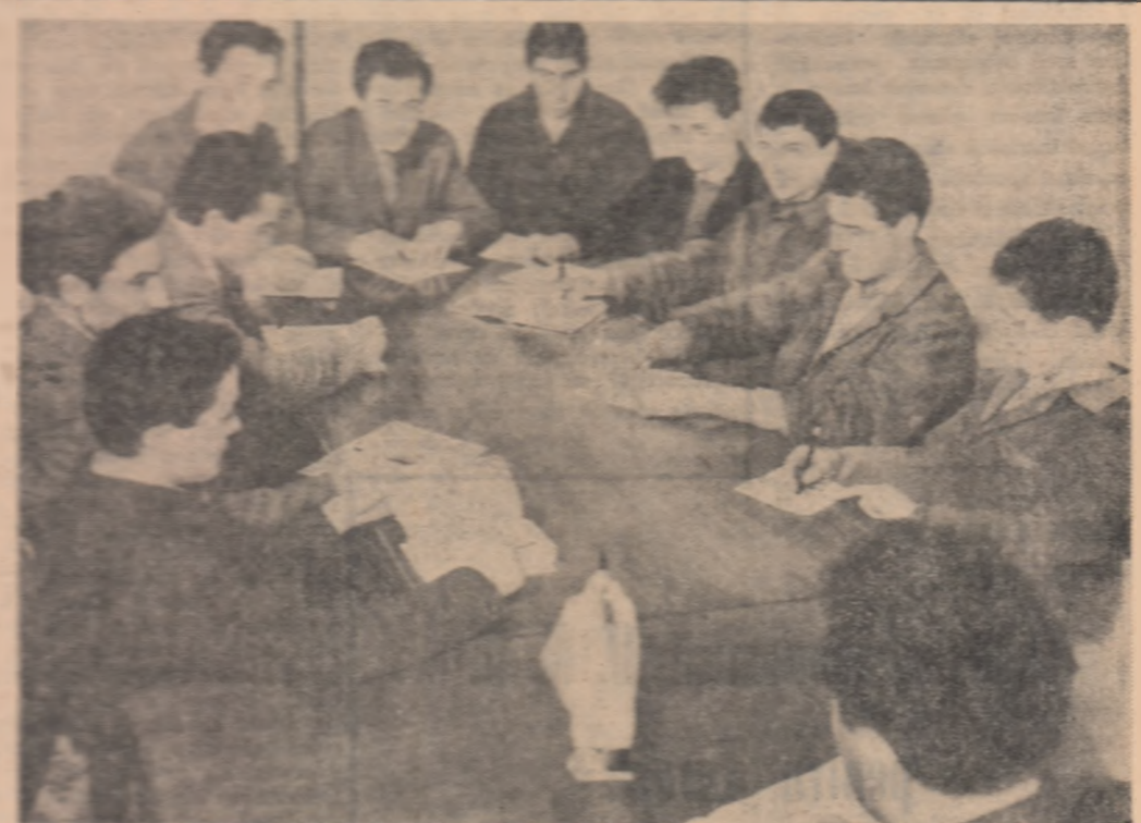
În timpul convorbirilor recapitulative care vor avea loc în peste două mii de unități politice U.T.M. din țară, tinerii vor avea ocazia să discute despre munca și răspunderile lor. În imagine sunt tinerii de la Uzina „Grivița Roșie” din București.

De la prima lecție din anul acesta să-mi creez o muncă cu cursanții și să-l folosesc pe care îl îndrumă și să-l motivez. În orice moment din discuții și la legătură între noi în mod obișnuit, în secție. Dacă am ajuns ca — spre deosebire de primele lecții — să conduc în seminar discuții vii, animate, aceasta se datorează în mare măsură, și faptului că permanent am îndrumat pe cursanții să lege întrebările generale reieșite din Statutul organizației noastre, de activitatea lor zilnică.