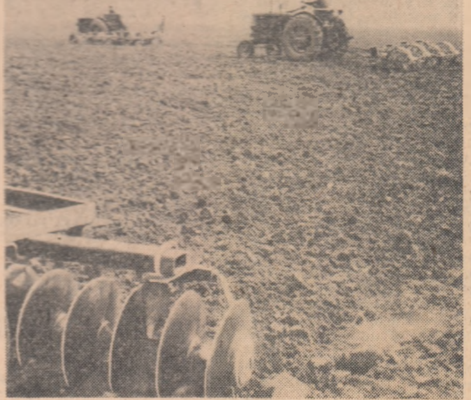
G.A.S. Trifești, raionul Iași, cultivă în fiecare an aproximativ 1 000 de hectare cu porumb.

In această primăvară, gospodăria are de îndeplinit aproape 1 100 hectare cu porumb. Semănătoarele cărora li s-a făcut proba în cîmp, sînt gata să intre în brazdă. Sînt pregătite 30 de tone de carburanți, discurile pentru semănătoarele 2 SPC 2, 20 tone de sămînță. Mecanicizatorii au procurat jaloanele, țîrșii, șfori pentru semănători, tăblițe pentru fiecare tarla.