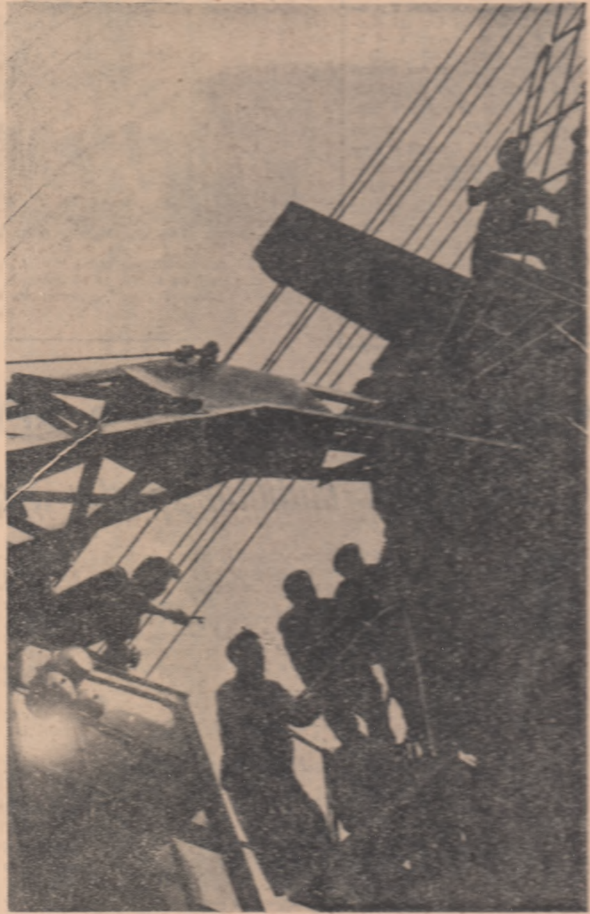
O întrecere maritimă pe catargele vechi Nicodim. Este vorba de o intervenție la unul din uriele scurtoare ale mizei Rovani