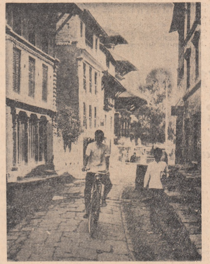
NEPAL. — Aspect de pe o stradă din Katmandu, capitala țării.

Interludiul N.A.T.O. de la Paris a justificat interesul și speculațiile observatorilor politici occidentali. Această confruntare aproape neașteptată asupra problemelor strategice N. A. T. O. a oferit un vast câmp de manevră, poate mai extins chiar decît la ultimele sesiuni ale Consiliului N.A.T.O. Minisrii apărării ai țărilor N.A.T.O., în declarațiile făcute la Paris, au susținut fiecare pozițiile binecunoscute: s-a pledat cu aceeași elocință în favoarea „ripostei masive”, ca și a „ripostei elastice”. Dar în subtext miniștrii aveau în vedere divergențele interoccidentale în complexul lor politic, militar și economic.