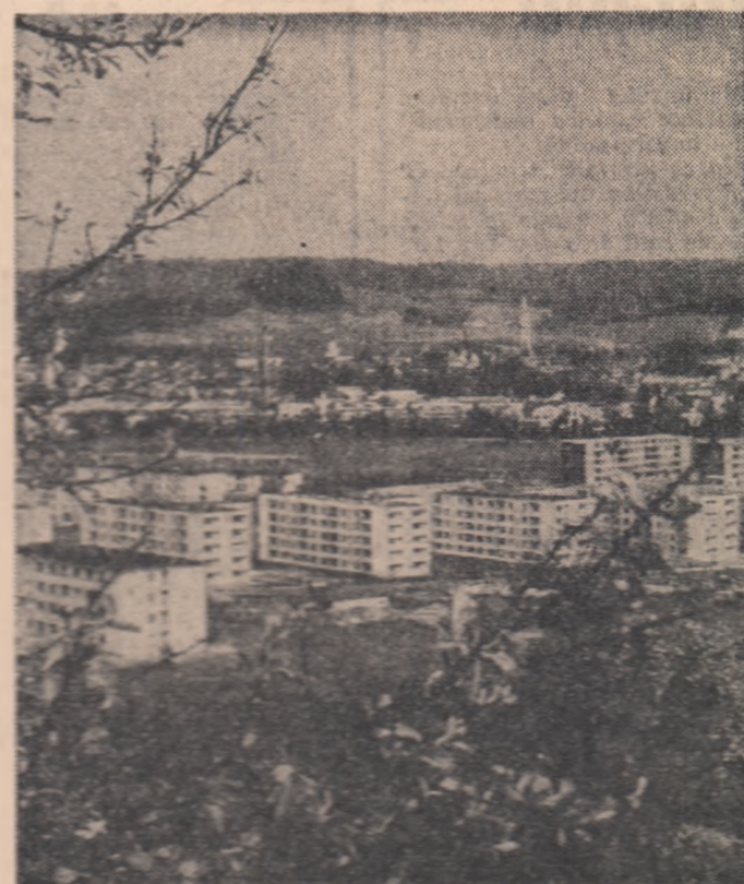
Locuințe noi în Medias, regiunea Brașov