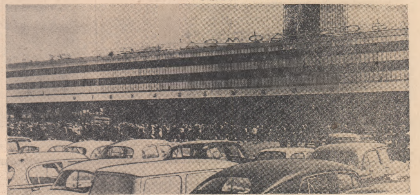
U.R.S.S. — Noul aerodrom „Domodedovo” din Moscova.

sînt obligate să fie în permanent contact cu fumătorii”. Terry a adăugat că există încă puține date disponibile în legătură cu incidența fumatului asupra familiilor, dar a precizat că „un număr apreciabil din totalul deceselor premature este înregistrat în rândurile fumătorilor”.