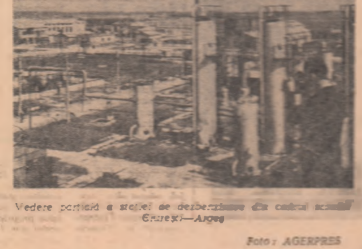
Vedere portuară a șefiei de dezerbarea din cadrul școlii Ghurexi—Argeș

triotice îl constituie strîngerea și predarea fierului vechi. În cursul zilei de ieri, la orele 14 au plecat spre Hunedoara primele 300 tone fier vechi, strînse de tinerii din localitate în vederea conferințelor regionale de partid și a celui de-al IV-lea Congres al partidului. Cu această cantitate au fost totalizate 1 392 tone din cele 2 300 tone