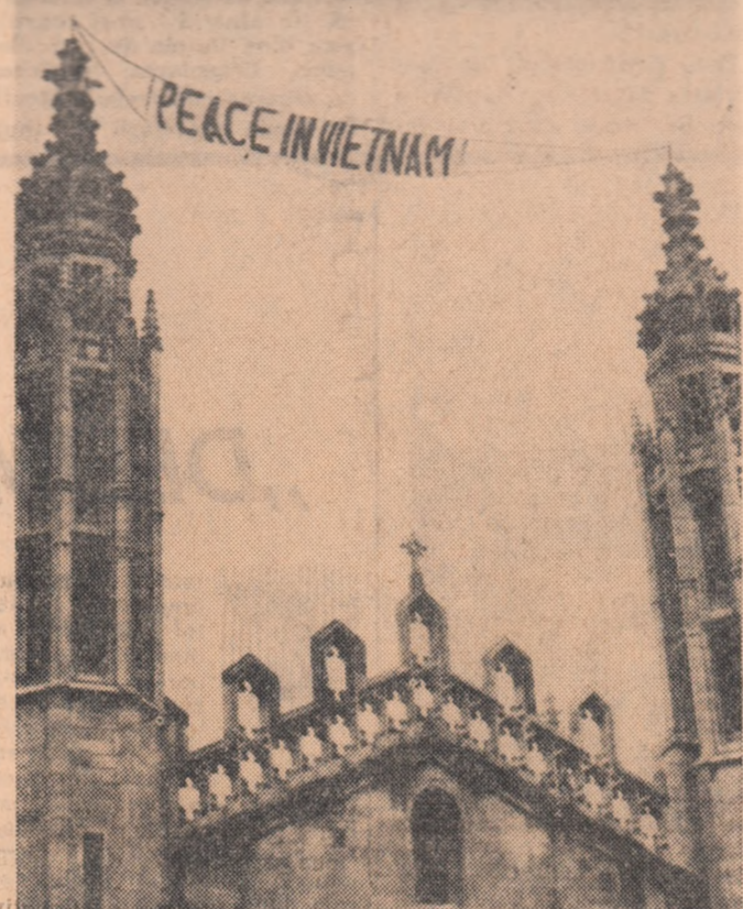
ANGLIA. — Pe două turnuri ale clădirii King's College din Cambridge, studenții au pus o lozincă care exprimă una din doleanțele lor: „Pace în Vietnam”.

REDACȚIA și ADMINISTRAȚIA: București, Piața „Scintei”. Tel. 17.60.10. Tiparul: Combinatul Poligrafic „Casa Școlii”.