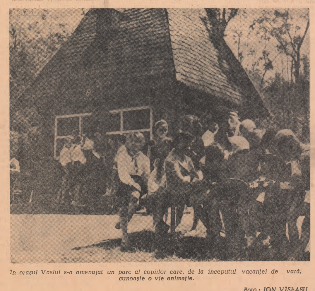
În orașul Vaslui s-a amenajat un parc al copiilor care, de începutul vacanței de vară, cunoaște o vie animată.

de credință a poetei care e, paradoxal, un refuz al feminității: „Aș vrea să iu urid Cînd trec străzile / Aș vrea să nu mă simt măsura / Frumusețea îndrăzneț / Pasii mi-i pot îndrăzneț / stăpînitori / Nu pentru că etalez comori de tîm-mușei întîmplătoare, / Eu pot înlumina”. Și această profesiune de credință dă înțelegere unei mari părți a poeziei cuprinsă în volum. Evident, pragul feminității nu poate fi sărit și o parte din versuri sînt de dragoste dar și pe aceasta poeta o supune unei transfigurări, unei priviri în afară care proiectează spațiului sentimentale îndrăgostirilor. În general, poeta se vrea un receptacol al vieții din jur, dovedind o sensibilitate deosebită la culoare: „Puteți să mă credeți, / Nu pierd nici un sunet și nici o culoare”. Cu toate acestea, receptia e foarte limitată înclint apului de mai sus e superfluu. Un ecou înregistrează poezia ei la munca de ridicare a orașelor și Vera Lungu încercă să scoalească prozaica descriere a schelelor și zidurilor vînd să dea glas sentimentelor la care obligă pe constructorii creșterea zidurilor cetădene: „Cum să nu iubim orașul acesta?” De nivel mediu, volumul e de cîteva ori personal în imagini și atitudini și promisiunile se cer urmăriți în viitor cu exigență. De aceea vom zice cu Miron Radu Paraschivescu „Binefăcînd poeta e încă la începutul marelui ei drum și al cumplitului angajament pe care îl presupune o astfel de poezie”. M. UNGHEANU