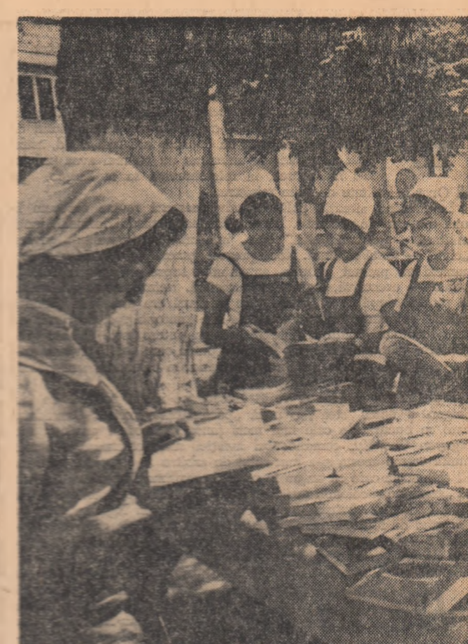
Stadiul de cârji de unitatea a II-a de Întreprinderi Flătară românească de bumbac — Bucu resti — pune la dispoziția muncitorilor ultimele noutăți.

În afară de aceasta, am luat măsura de a fi redistribuite stocurile existente de piese între întreprinderile de aprovizionare. Tot în scopul înlăturării rămînelor în urmă la reparațiile utilajelor ce vor fi folosite în apropiata campanie de seceriș, s-a luat măsura de a se recondiționa operativ toate piesele ce mai pot fi reutilizate.