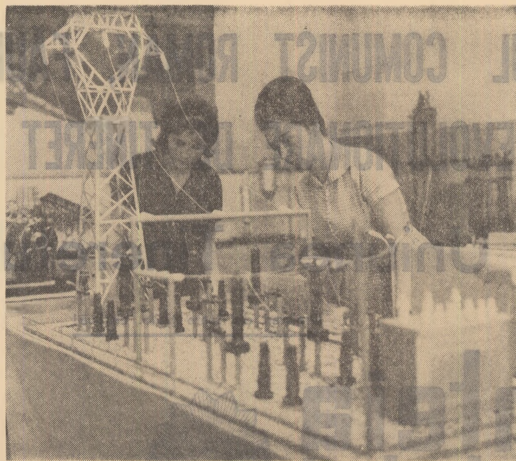
Aspect din expoziție

Ne-am propus să studiem totul cu mai sistematic și să adunăm date, material documentar concludent pe sectoare de activitate. Scopul nostru era realizarea unor imagini cît mai exacte asupra trecutului și prezentului unei zone istorice