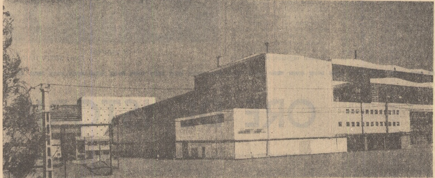
Aspect exterior al fabricii de acid sulfuric a Combinatului Chimio de la Turmă Măgurele

ÎN ACEST NUMĂR: • Tezaur de gândire revoluționară (70 de ani de la moartea lui Friedrich Engels). • Ore de istorie la fața locului. • Rubrica: „Cu ochi de specialist, cu mină de gospodăru”. • Rubrica Sport. • Carnet cinematografic.