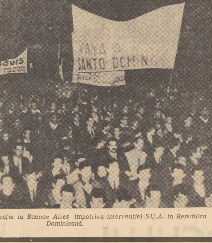
ARGENTINA. — Demonstrație la Buenos Aires împotriva intervenției S.U.A. în Republica Dominicană.

Între timp, se arată într-un comunicat american. De asemenea, un punct înfrînt al trupelor de la Saigon a fost cucerit recent de forțele patriotice.