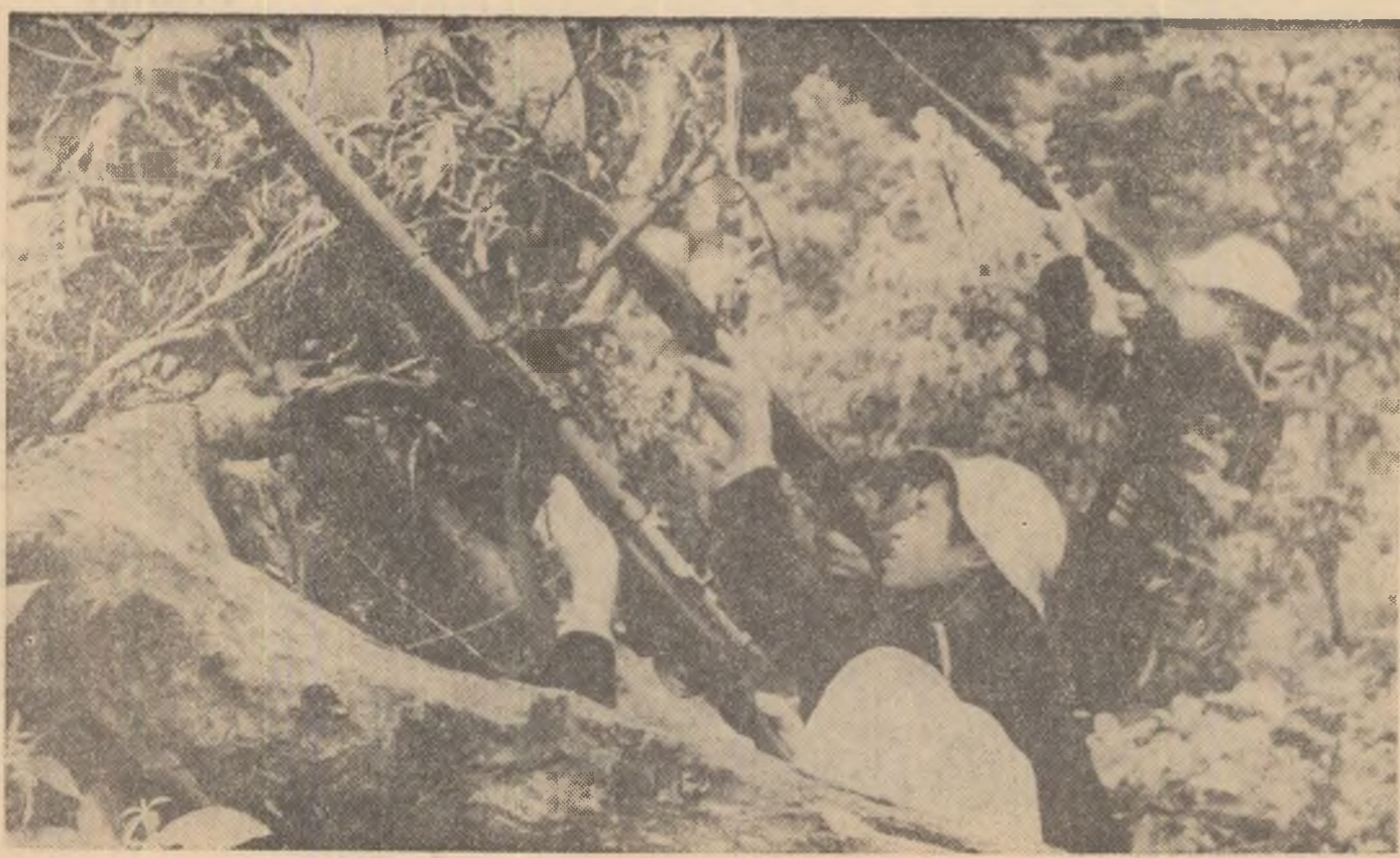
VIETNAMUL DE SUD. — Ostași ai Frontului național de eliberare din Vietnamul de sud, deschid focul împotriva elicopterelor americane.