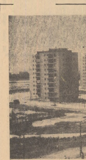
R. P. UNGARĂ. — Noul cartier Lagymanyos din Budapesta

Tot marți, membrii Comisiei O.S.A. s-au întîlnit cu reprezentanții ai guvernului lui Imbert Barreras, precum și cu candidatul la postul de președinte al proiectatului guvern provizoriu dominican, Garcia Godoy. Se relevă că au fost purtate discuții amănunțite asupra noilor propuneri ale Comisiei O.S.A. După întreve-