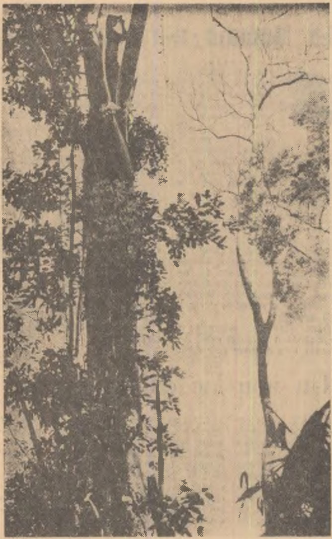
VIETNAMUL DE SUD. — De la înălțimea unui copac din junglă, un oșac al forțelor patriotice urmărește mișcările trupelor inamice.