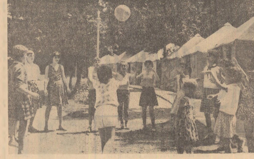
În vacanță, la tabăra din pădurea Pustnicului