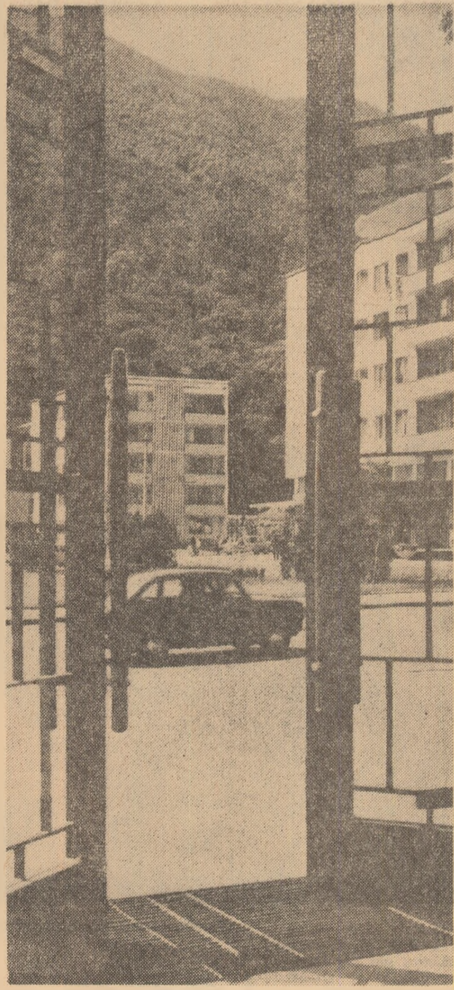
Din noul poezie-și oragăsiți Bragov.

Dar poate fi mai mare bucurie decît secunda ce va bate-atunci, cînd pină-n depărtări, din temelie va izbucni lumina-nrîgii munci și-un sentiment mai pur și mai înalt există decît întreg, și pină în adînc, să fii părtaş în România Socialistă la strălucirea ei, în orice zi.