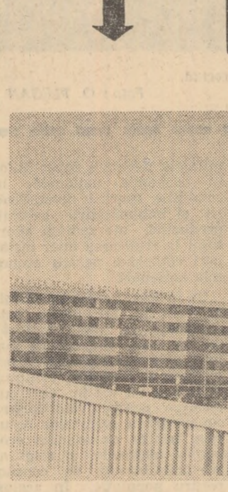
Perspectivă spre centrul orașului „Gheorghe Gheorghiu-Dej”

pectarea judicioasă a programului de grajd, aplicarea cu rigurozitate a normelor sanitare, îmbunătățirea tehnicii muncii etc. Unitățile citate au depășit, la 15 septembrie, 1700 litri de lapte pe cap de vacă furajată. Fiarele acestor producții nu poate fi atribuită integral specializării la gatastorie. Specializarea este numai un mijloc pentru un complex larg de măsuri de calificare întreprinse în aceste cooperative pentru sporirea producției de lapte. Formele de calificare a tinerilor zootehniști sunt multiple. Ele diferă de la un raion la altul. Am reținut însă, ca o coordonată comună, preocuparea unor conducători de unități și a unor organizații U.T.C. de a da continuitate, permanentă procesului de calificare. — Tinerii din sectorul nostru zootehnic sunt elevii la o școală... iată vacanță — ne-a declarat tovărășul Vasile Cobzar, secretarul comitetului organizației U.T.C. din cooperativa agricolă Corniște, regiunea Ploiești. După încheierea cursurilor