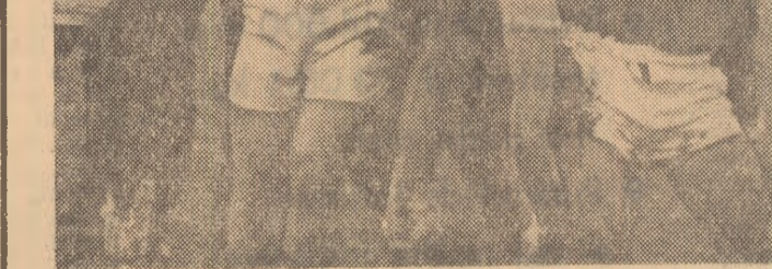
O iază din meciul de rugbi Steaua-Dinamo, disputat duminică