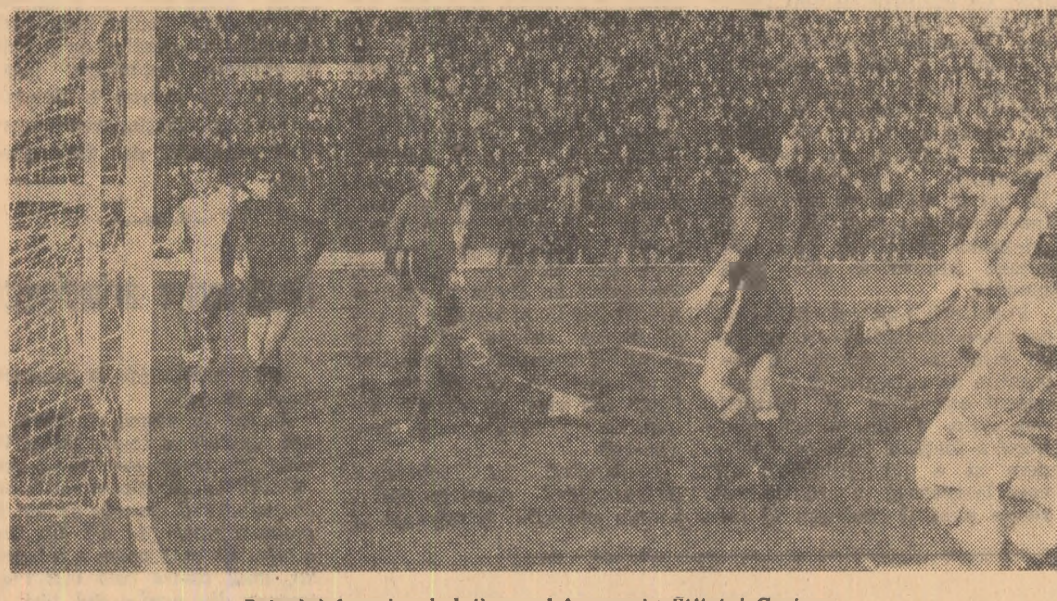
Petrolul inserie al doilea gol în poarta Științei Craiova

19,00 Jurnalul televiziunii (I). 19,15 Emisiune pentru copii și tineretul școlar. 20,00 Teleanthropologie. 21,00 Cu masca... și fără masca. 21,15 Film: Sfiștuit. 23,10 Jurnalul televiziunii (II). Sport. Buletin meteorologic.