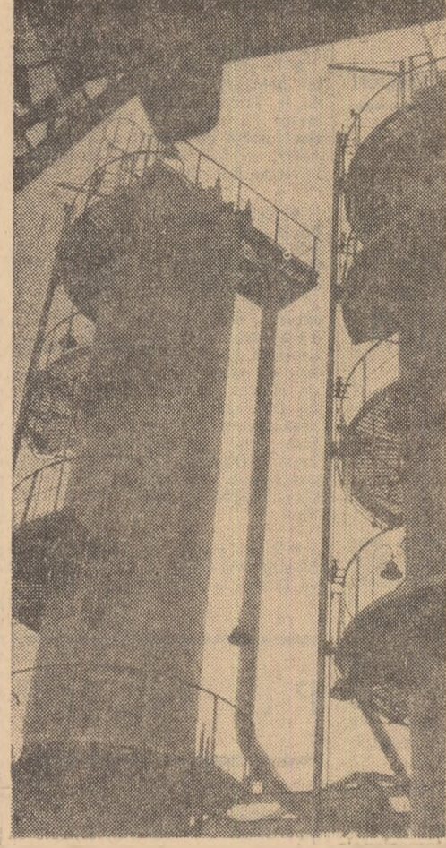
Aspect al noii instalații de reținerire catenă la Rădăuți din Orașul Gheorghe Gheorghiu-Dej intrată în funcțiune

Recent, relevul a fost brevetat ca invenție. El va fi în curînd experimentat în rețea, în paralel cu un relev de tip obișnuit, după care va fi fabricat pentru nevoile industriei energiei electrice.