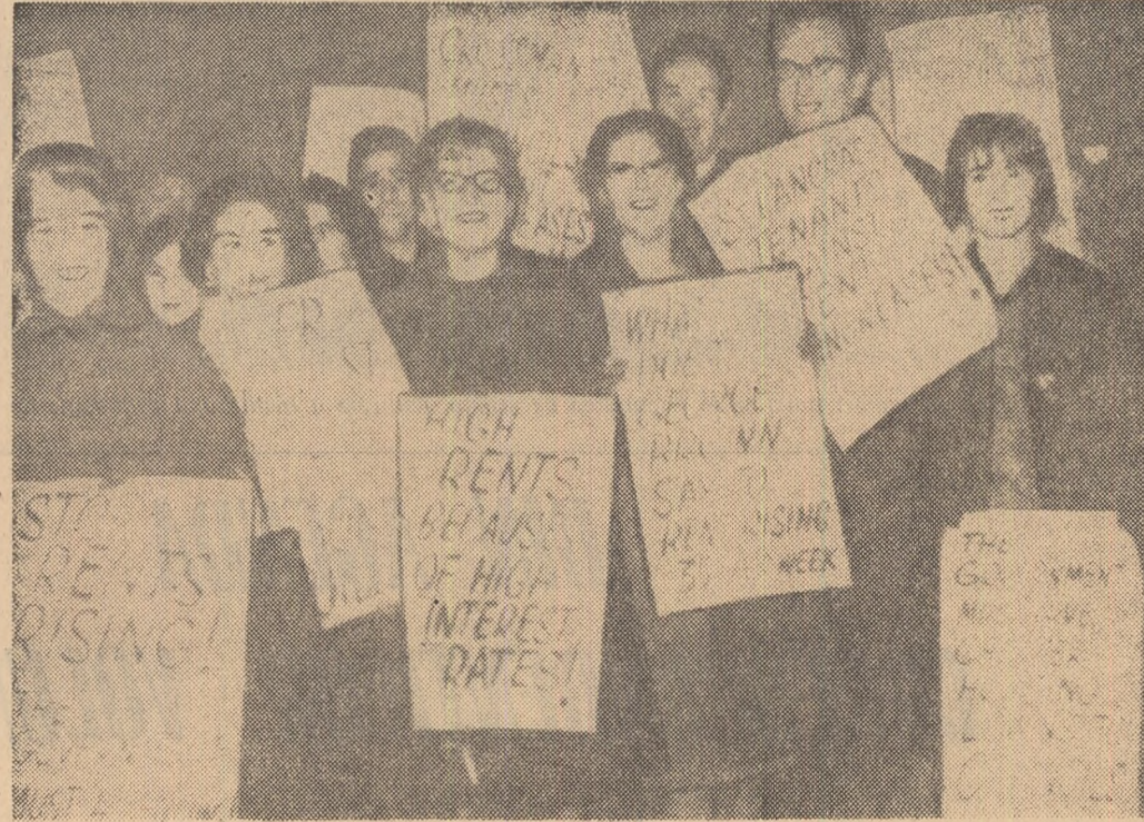
LONDRA. — Demonstrație a femeilor împotriva majorării chiriilor