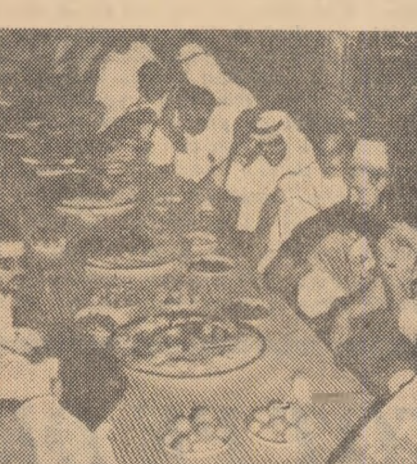
HARAD: Republicani și regaliști, împreună

Ideea întreruperii conferinței de la Harad nu provine numai din calendarul religios. Liderii republicani și monarhiști din Yemen nu au găsit încă drumul înțelegerii. Fără îndoială, nimeni nu putea să creadă că dialogul de la Harad ar fi lesnicios. Cele două tabere sînt despărțite printr-o prăpastie amplificată de un singeros război civil. Dar nu este vorba doar de conturile trecutului. Trecutul — s-ar părea — preocupă mai puțin. Frunții politici yemeniți se gîndesc la viitor. La Sanaa, guvernul republican atrage atenția că reconcilierea națională nu înseamnă și însemnează că însemnează abandonarea cuceririi populare și revenirea la regalitate. Pentru republicani nu se pune problema schimbării regimului, ci a desemnării acelor per-