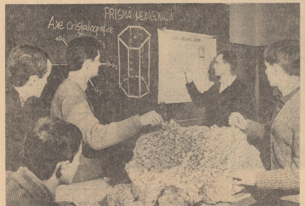
Grupul școlar minier Baia Mare. Lecție despre cristalografia hexagonală a rocilor