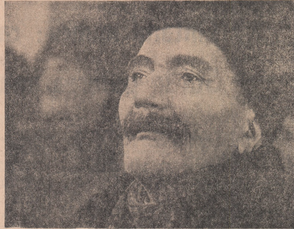
„...cînd eram în floarea vîrstei, ca cel mai mulți dintre oamenii din jurul meu, niciodată n-am îndrăznit să mă gîndesc că la bătrînețe eu, un jăran, voi ajunge să primesc pensie...”