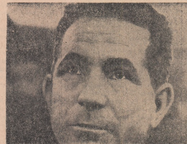
„Nu poți să nu fii mîndru cînd într-o asemenea adunare se vorbește despre contribuția tinereții. Oare eu am făcut totul? Multe și folositoare treburi avem de realizat anul acesta. Putem și trebuie să le facem!”