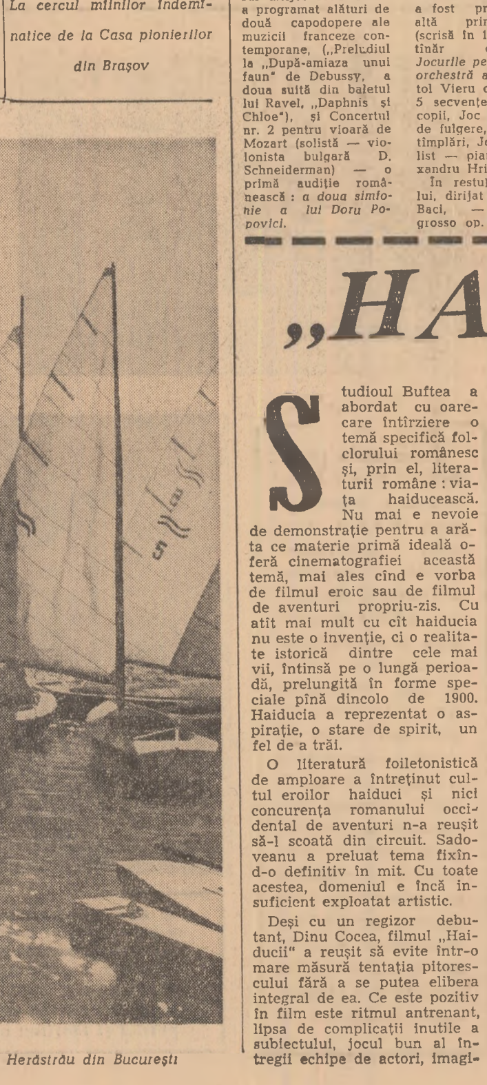
Pe lacul Herăstrău din București