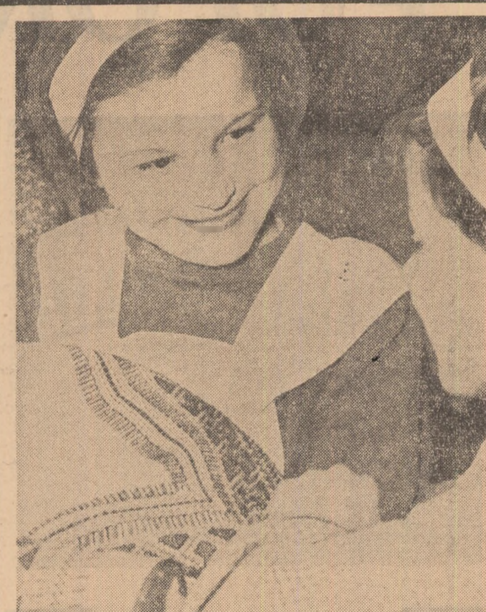
La cerul minilor îndemnatice de la Casa pionierilor din Brașov