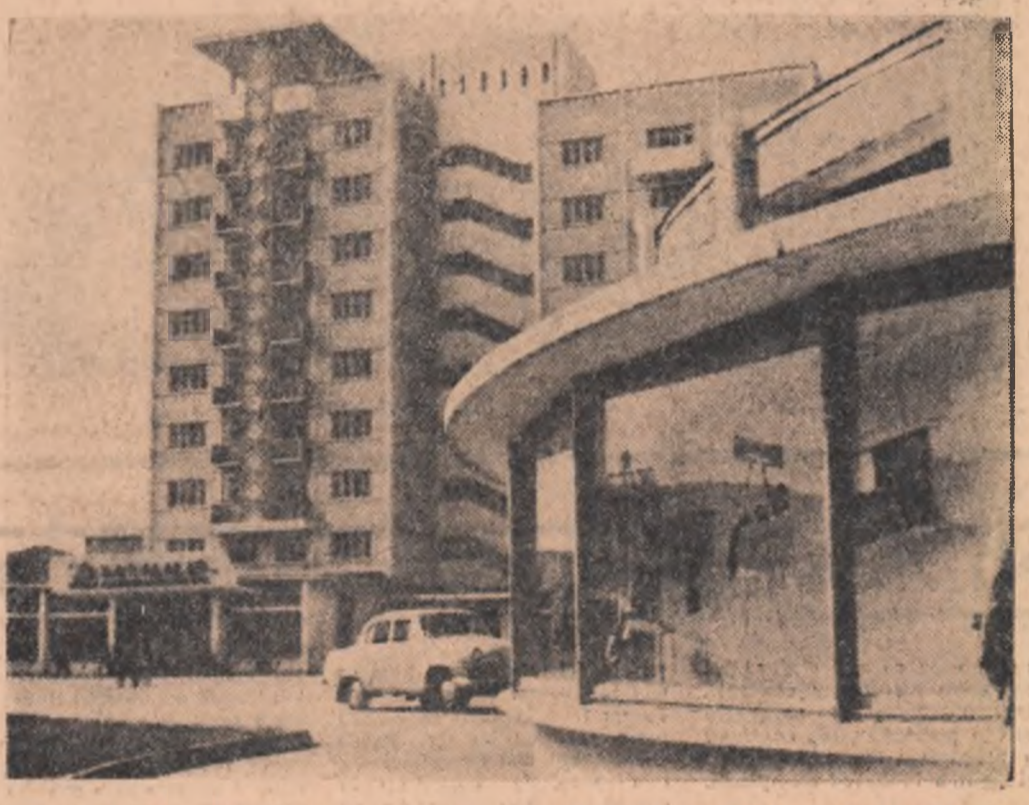
Construcții noi îmbogățesc peisajul orașului Ulan Bator, capitala R. P. Mongole

La Bonn și cei 72.000 de militari francezi aflați pe teritoriul Germaniei occidentale. După cum se știe, cancelarul Erhard și-a exprimat dorința ca trupele franceze să fie menținute în continuare în Germania occidentală după 1 iulie, în cadrul unui nou statut, care urmează să fie elaborat pe calea unor negocieri bilaterale franco-vest-germane. Pînă la stabilirea acestui statut, delegatul propus urmează să îndeplinească unele misiuni asigurate pînă la 1 iulie de comandamentele militare integrate ale N.A.T.O. Atît Ambasada franceză de la Bonn cît și Ministerul de Externe vest-german au refuzat să dezvăluie conținutul notei franceze.