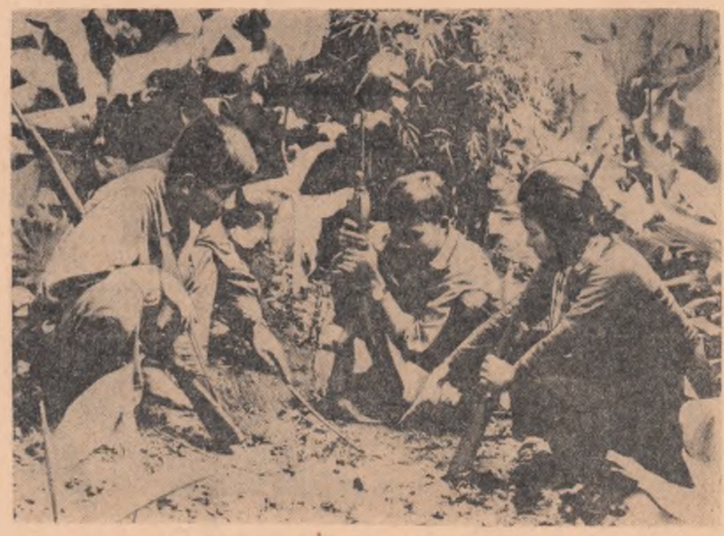
În Vietnamul de sud, patrioții continuă acțiunile împotriva trupelor americano-saigoneze. În fotografie: Undeva în provincia Cu Chi, un grup de patrioți pregătesc planul unei noi acțiuni

În acest miez de vară, Kisangani este scena unor întâmplări singeroase. Simbătă dimineața mercenarii albi — adunători de elemente cerțate cu legea — au atacat cartierul general al unităților armatei congoleze. Au izbucnit lupte. Mercenarii au primit sprijinul celor 3.000 de jandarmi katanghezi amplasați în oraș.