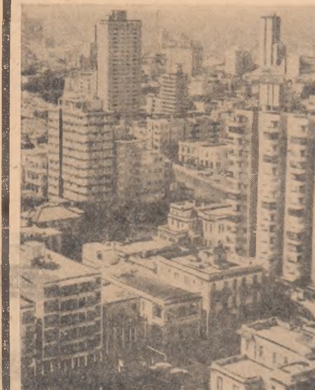
O imagine din Havana

Cu prilejul sărbătorii Cubei libere, tineretul român, întregul nostru popor, transmit poporului și tineretului cuban calde urări de noi succese în lupta pentru consolidarea independenței naționale, pentru înflorirea patriei, pentru socialism și pace.