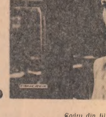
„Cadru din filmul „Omicron”

Din ceea ce e sincer și deși neconvertit în parodie gratuită, ușuratec, intrucît tratează nepotrivit aspecte dintre cele mai grave ale unei realități sociale contradictorii, se poate înțelege că mesajul progresist — cit e — al acestui film rezidă într-o vagă sugereare a încrederei în invincibilitatea conștiinței umane.