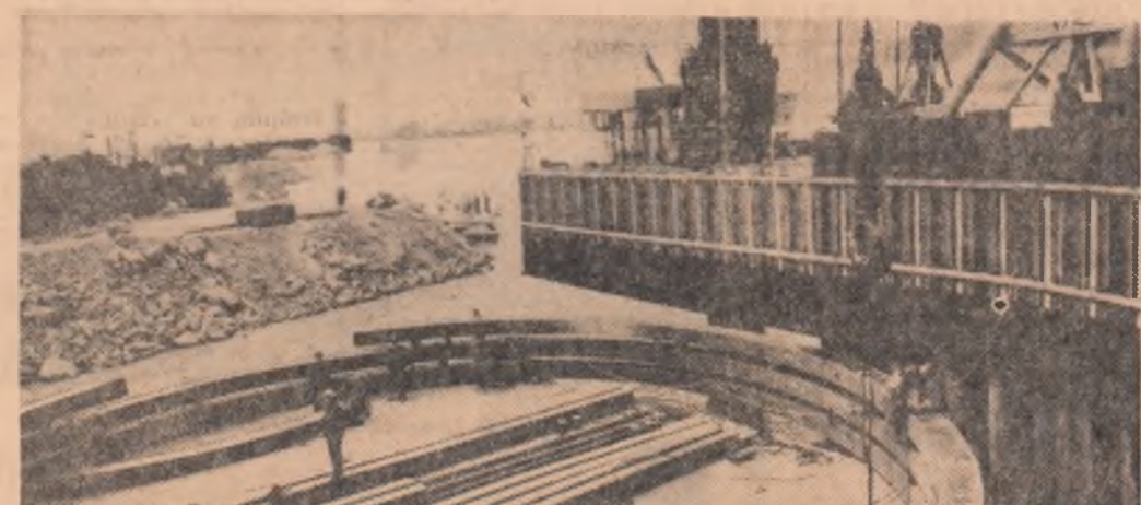
Unul din „inelele” cu ajutorul tralor de la Porțile de Fier căruia constructorii hidrocentralei au construitul hidrocentralei

Direcția Generală Construcții Montaj a Sfatului popular al Capitalei a deschis o expoziție în care sînt expuse materiale de construcții și produse ale întreprinderilor din București. Se remarcă mostrele prezentate de I.P. Granitul, I.M. „7 Noiembrie”, I.P.L.C., I.C.M.R.U.G., I.C.M. 2.