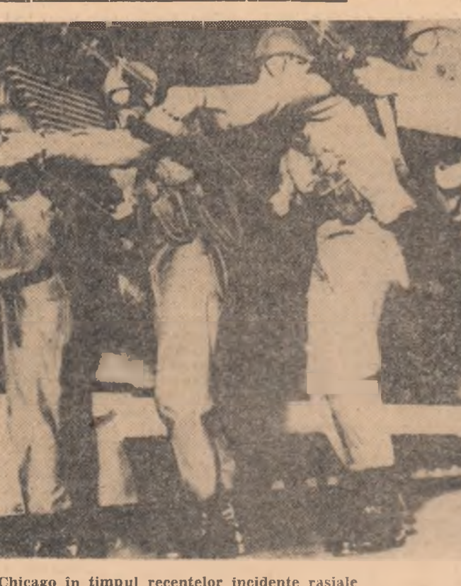
S.U.A. — La Chicago în timpul recentelor incidente rasiale

ÎN SATELE din Cuba, unde înainte de revoluție nu exista nici un spital și nici un medic, funcționează acum 95 de spitale și policlinici. Personalul medical superior, care înainte lucra în marea sa majoritate la Havana, este acum repartizat proporțional în întreaga insulă. A crescut de cîteva ori numărul cadrelor sanitare cu pregătire medie și inferoară. În 1965, alocațiile bugetare pentru ocrotirea sănătății au crescut de 7 ori față de 1958.