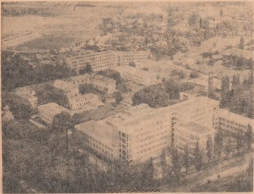
Înainte, acest oraș era „celebru” prin mahalalele sale insalubre. Unul din marii noștri poeți îi înscrisese tristețea în versurile sale, singură măturărie rămasă în acest peisaj rănducit