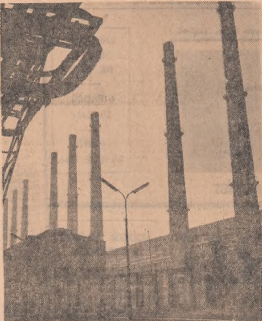
Aceste opt coșuri sînt un indiciu sigur pentru numele orașului pe care trebuie să-l recunoașteți