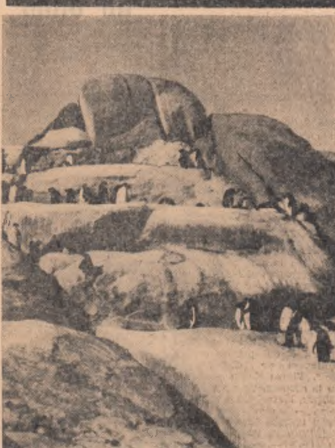
Vara se face resimțită și în Antarctica. Aparatul fotografic a surprins un grup de pinguini încălzindu-se la soare în apropiere de stația sovietică Mirnii