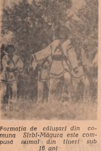
Formația de călușari din comuna Sîrbi-Măgura este sub compus numai din tineri sub 16 ani

Revenim la Șantierul naval din Galați după o lună și cîteva zile de cînd a avut loc lansarea la apă, cu 60 de zile mai devreme, a celei mai mari nave construite la noi în țară: mineralierul de 10 200—12 500 tdw. Pe cală rămasă liberă, cel de al doilea mineralier de 10 200—12 500 tdw a început să capete contur. Din nou macaralele, care pîmbă utilaje și mașini moderne, au intrat în funcțiune cu întreaga capacitate. Ritmul de lucru realizat pînă acum este superior celui obținut la prima navă. Constructorii navali de la