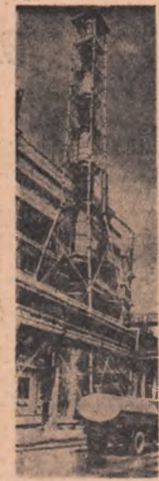
U.R.S.S. — Imagine de la uzina de săruri fosforice din Cimken

În legătură cu situația din Vietnam, J. Kádár a spus că S.U.A. duc un război de colonizare în Vietnamul de sud, iar împotriva R.D. Vietnam comit zilnic agresiuni armate.