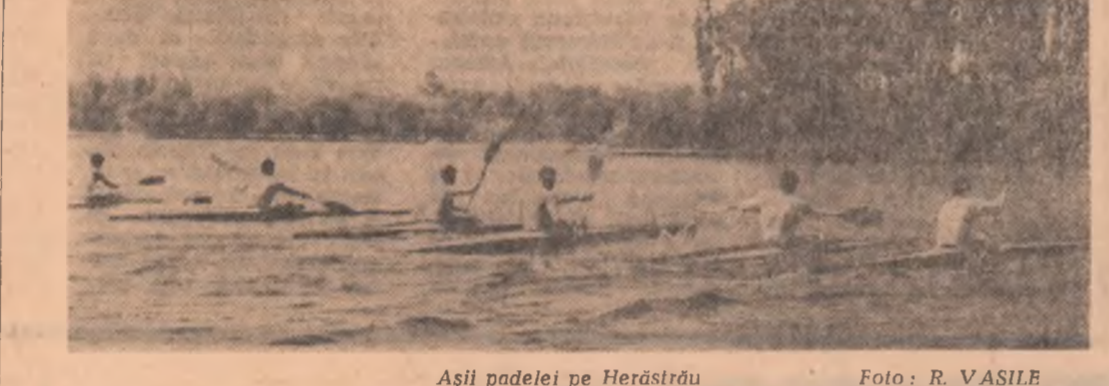
Așii padelei pe Herăstrău