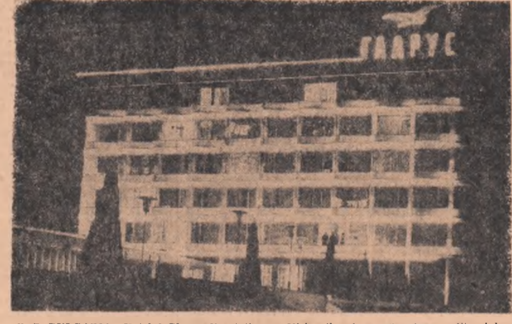
R. P. BULGARIA: Hotelul Glarus din stațiunea „Nisipurile de aur” de pe litoralul Mării Negre