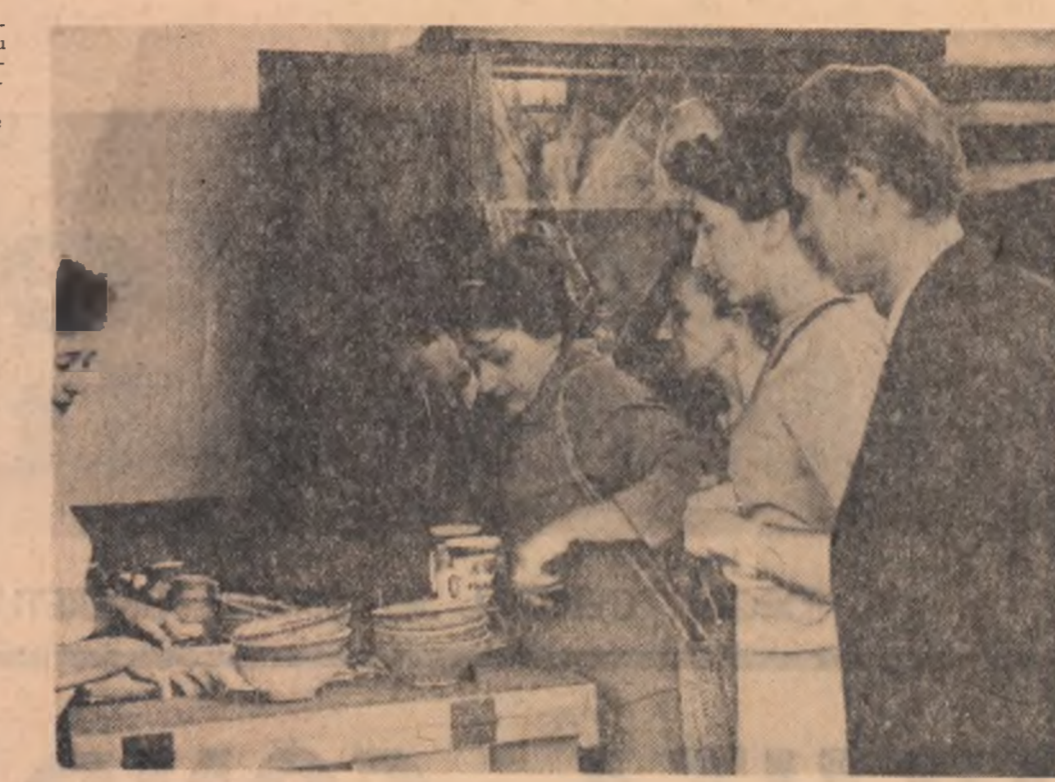
Standul expoziției de artizanat de la Muzeul satului

În întinsele păduri ale regiunii Huedoara, campania strîngere a fructelor de pădure este în plin. Întreprinderile forestiere au organizat din timp s-a această campanie, mobilizînd toate forțele