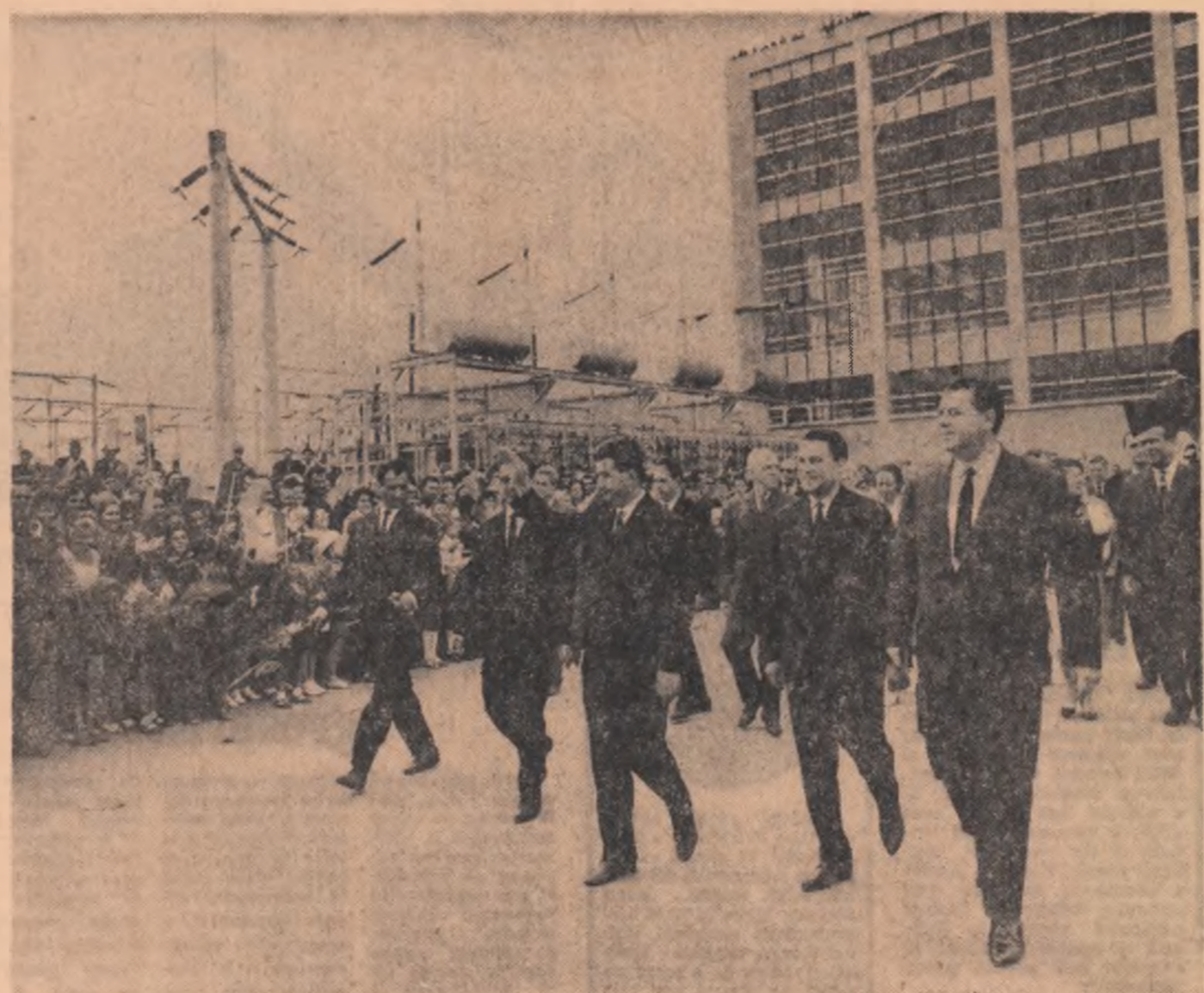
La termocentrală de la Luduș

Cu etiva ani în urmă, aceste localități erau aproape necunoscute pe harta economică a țării. Din 1961 încoace numele lor a devenit simbolul luminii, energiei, forței. La îndemnul partidului, constructorii au înălțat la Luduș-Iernut una din cele