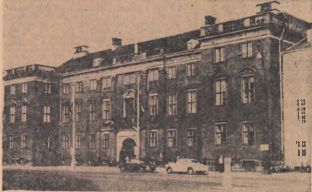
DANEMARCA. — Clădirea Academiei de arte din Copenhaga

ția americană nu poate rămîne nepe-depsită. Participanții la miting au subliniat hotărîrea lor de a menține în orice condiții și de a depăși producția și în același timp de a îi gata întodeauna de luptă.