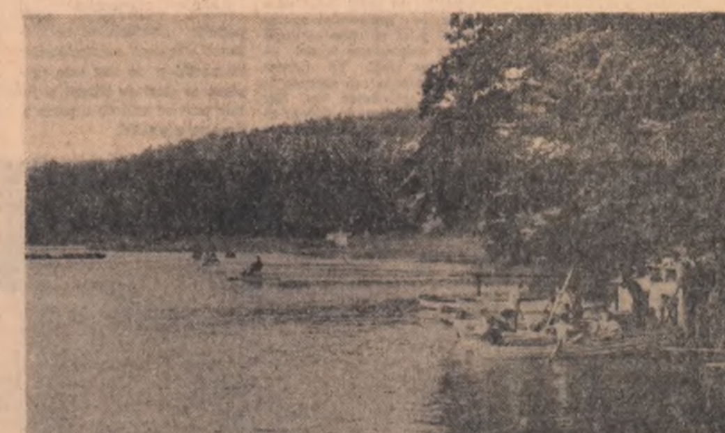
Pe lac, la Dumbrava Sibului