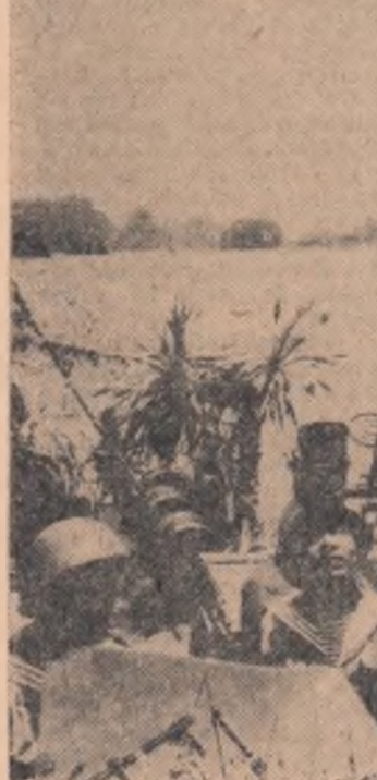
R. D. VIETNAM. Ostași din flota maritimă militară în timpul unui exercițiu de luptă

OSTAȘI DIN FLOTA MARITIMĂ MILITARĂ ÎN TIMPUL UNUI EXERCITIU DE LUPȚĂ