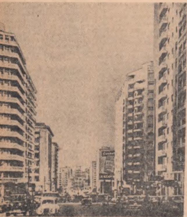
Pe una din străzile principale ale orașului Montevideo

Astăzi este sărbătoarea națională a Uruguayului. Se împlinesc 141 de ani de la proclamarea independenței Republicii Orientale Uruguay.