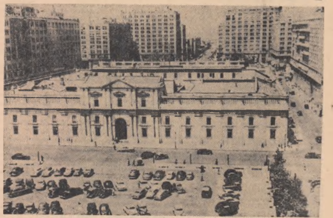
CHILE. Imagine din Santiago de Chile

Recent s-a anunțat că o companie britanică și două societăți nord-americane au obținut concesiuni pentru prospectarea și exploatarea zăcămintelor de petrol ale țării. Pateronica companie nord-americană „Raynolds Metal Co.” a încheiat un contract cu guvernul guyanez, în baza căruia a căpătat dreptul de a explora 250 000 acri de pămînt unde există importante zăcăminte de bauxită. Drept răsplătire pentru „mărinimia” dovedită prin hotărîrea de a „accepta” această concesiune, conducerea societății a primit din partea guvernului Guyanei drept