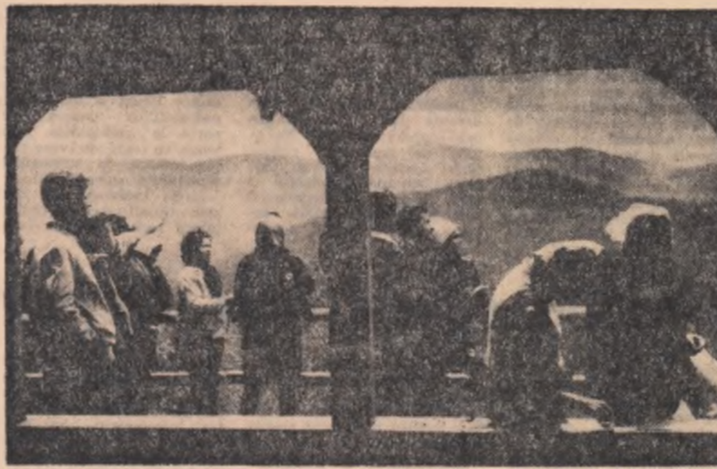
Foto: GHEORGHE PETRUSE activist al Comitetului raional Clujeni al U.T.C.

Scurt popas la cabana de la Ghețari, Scărișoara din Munții Apuseni