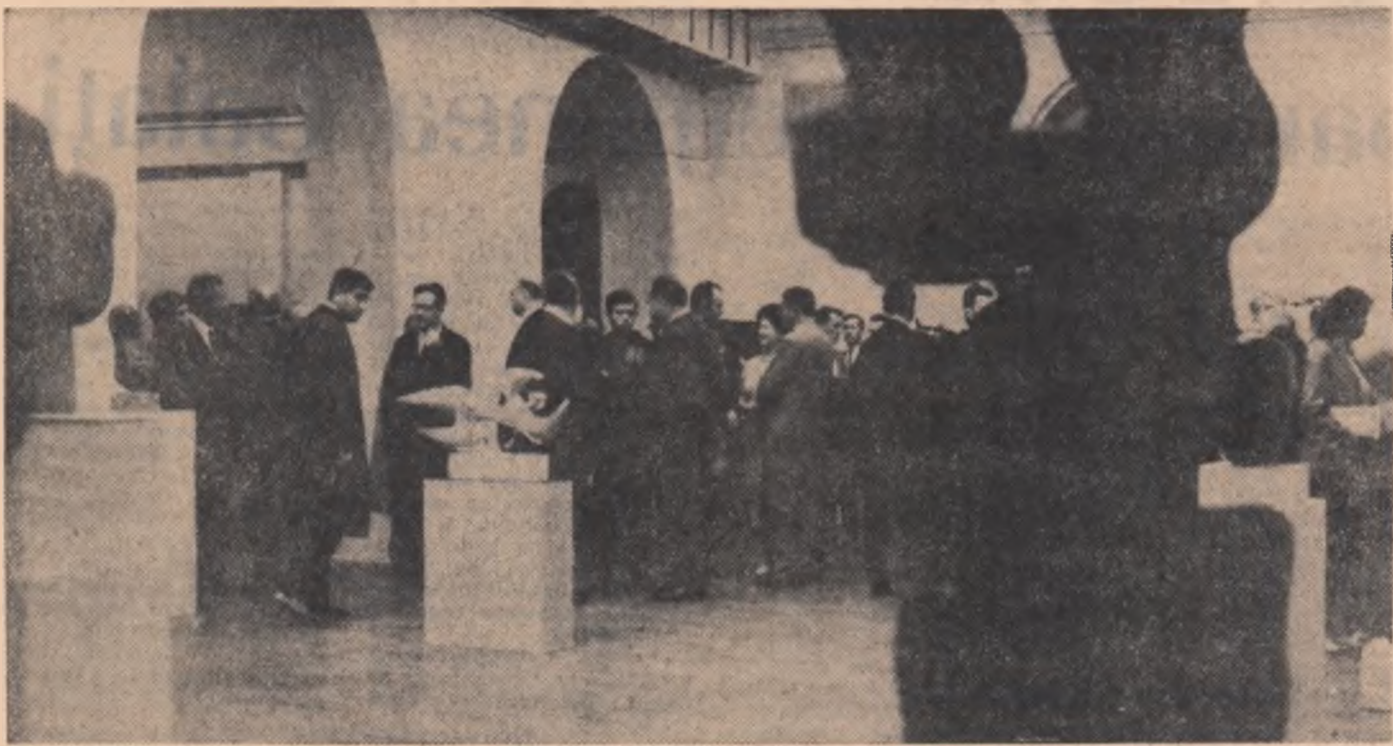
R. P. UNGARĂ. Aspect de la expoziția de artă plastică românească deschisă recent la Budapesta