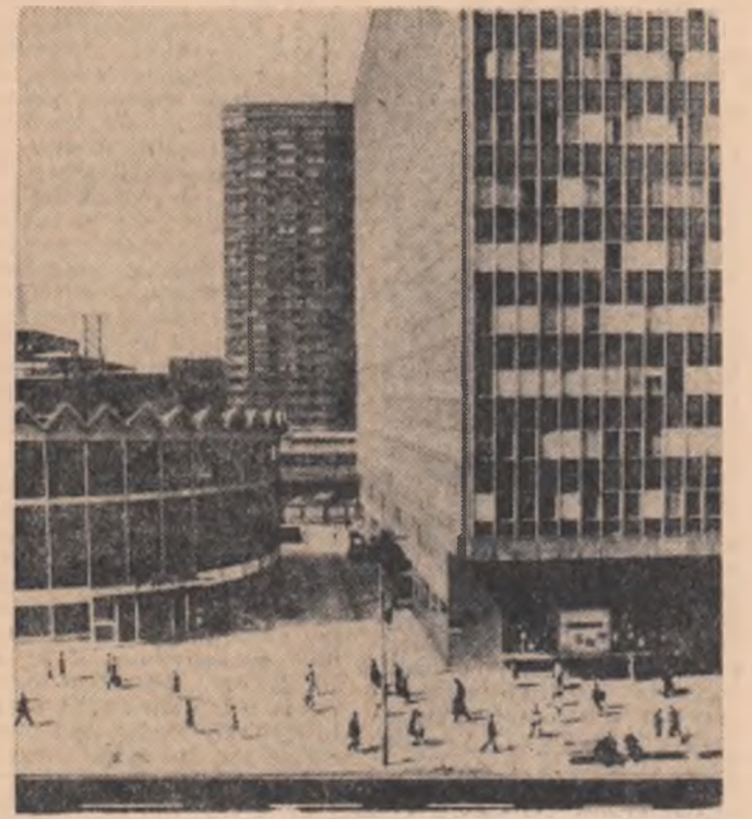
R. P. POLONĂ. — Vedere din centrul Varșoviei

R. P. BULGARIA. Noi tipuri de freze care efectuează mai multe operațiuni