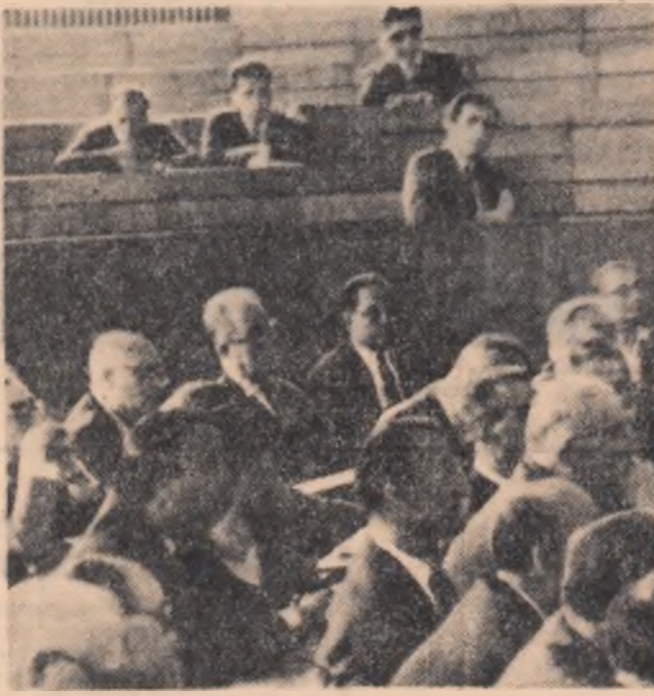
Aspect din timpul lucrărilor