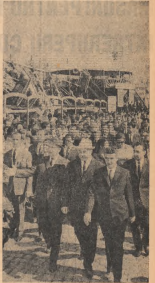
Conducătorii de partid și de stat în vizită la expoziția...