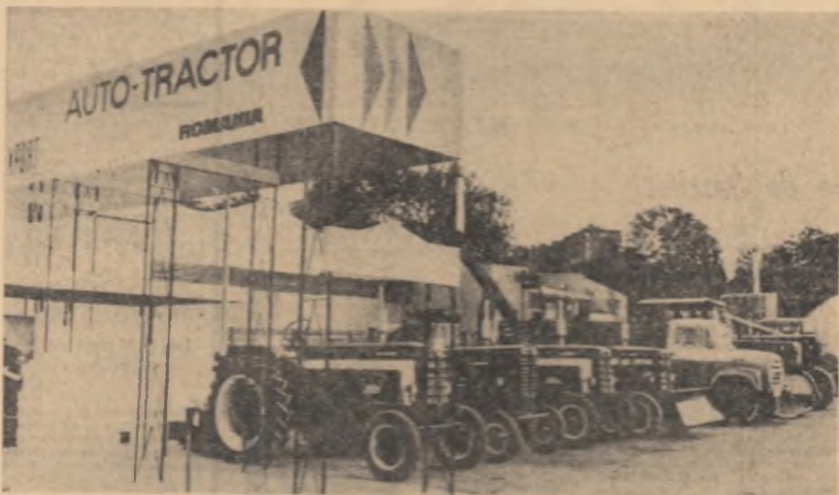
SEEDA — Aspect de la expoziția românească de mașini și utilaje din cadrul Tîrgului Internațional de la Stockholm

După cum se arată din discurs, este în mod clar că guvernul este conștient de necesitatea de a moderniza industria de armament, care este considerată ca o prioritate. Guvernul este conștient că trebuie să găsească în industria de armament o sursă de finanțare pentru a-și susține politica de susținere și de energie pentru țările în curs de dezvoltare.