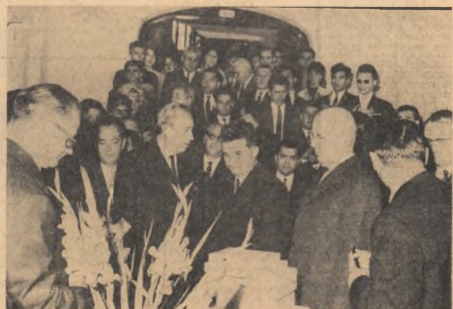
În incinta Universității

O mare de studenți tălăzua, ieri în piața Universității, marțora atitor momente din trecutul de luptă al Bucureștiului. Și s-ar fi spus că fiecare cîntec, întonat de voci tinere în acest luminos început de octombrie, era un răspuns fericit dat unor vremuri cînd studenția echivala cu mizeria și nesiguranta zilei de mâine.