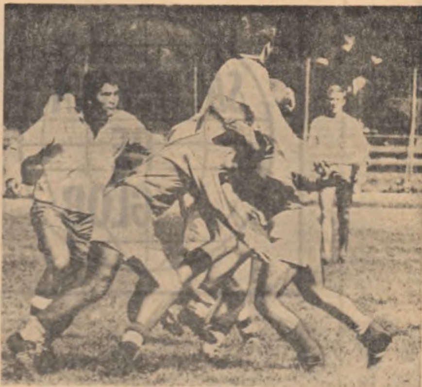
Lupta pentru balon în partida dintre Grivița Roșie și Dinamo București