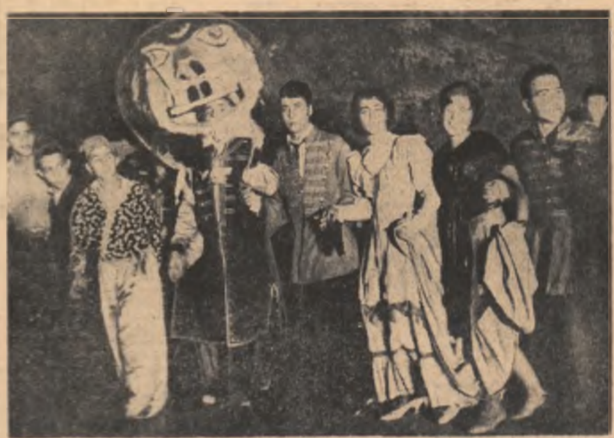
La Carnavalul recoltei

In aceeași Dobrogea, alții au obținut și mai mult decît cei din Comana. La „Pînțița”, cei din Bîltăgești — cooperativorii și mecanizatorii — au ciocnit ucelele cu tubulere și s-au felicitat pentru cele 3.250 kg griu cit au obținut la hectar, pentru sutele de kilograme cu care au depășit producțiile mediilor porumb și floarea soarelui. Și cei din Viile — raionul Adamclisi au avut pentru ce se închina: 10.000 kg porumb și țîletii la hectar nu-i o glumă! Inginerii și mecanizatorii, la G.A.S. Amzacea hotărîseră, la început, să închine cite un