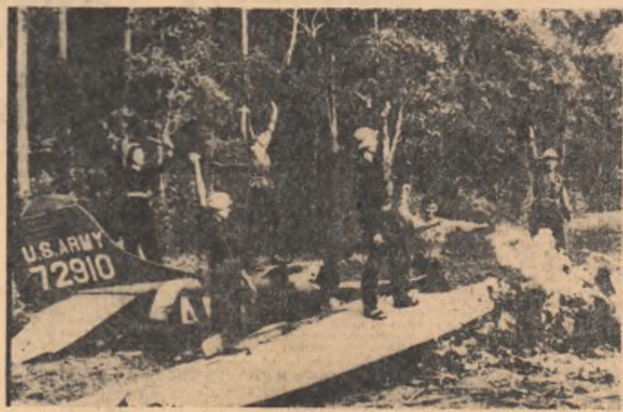
VIETNAMUL DE SUD. — Luptători ai forțelor patriotice alături de resturile unui avion recent doborât