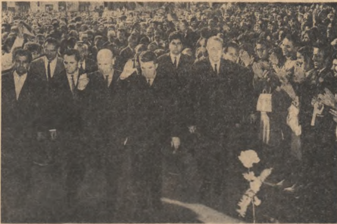
Vasta piață a Universității bucureștene răsundă de aclamațiile miilor de studenți

În această zi, în prezența secretarului general al C. C. al P. C. R., Nicolae Ceaușescu, și a celorlalți conducători de partid și de stat, a avut loc deschiderea anului de învățămînt