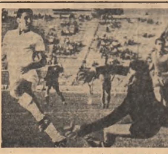
Brădă înscrisă peșteră gol pentru Dinamo în partida cu Rapid

CLUJ (prin telefon de la trimisul nostru). Duminică, într-un cadru festiv, a avut loc deschiderea oficială a ediției publicitare — a X-a — a Campionatelor europene feminine de baschet. La Cluj, jocurile s-au disputat în frumoasa sală a sporturilor. Ceașcă peșteră din cadrul primăriei este „anexată” ca fost în măsură să deosebească înmușcatei acestui sport: acțiunile colective încheiate, repere rapide, contestații acurii surprinzătoare, presing pe tot terenul. Eraldă este calitatea, echipa sovietică s-a impus categoric în grupa de la Cluj. Italia a fost un adversar vesement care a câștigat complet la reluare. Înscrind doar 11 puncte în repriza secundă. Scor final: 42-26.