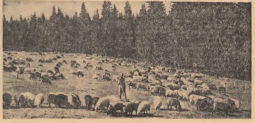
La păsănat în Munții Rodnei

În grădina botanică din Cluj a fost creată, din sute de tone de pămînt, macheta unui lanț muntos reprezentînd masivele Făgăraș, Retezat, Bucegi și Rodna. Tot aici a fost amenajată o stîncărie populată cu specii din familia campanulacee. În grădina japoneză, în zona sacifragaceelor, precum și în toate secțiunile cu floră și vegetație continentală au fost făcute completări și amenajări. Botanicii clujești recoltează atât din grădina, cît și din flora spontană a țării, semințele necesare relațiilor de schimb pe care le întretin cu peste 500 de grădini botanice din lume.