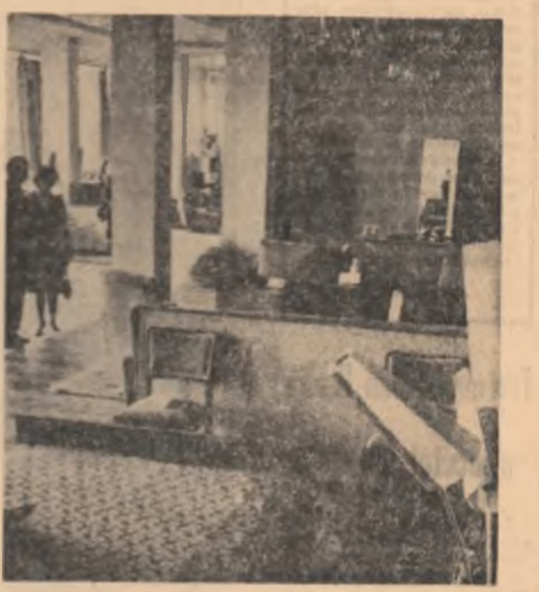
În expoziția de mobilă cu vînzare, deschisă recent la Baia Mare

Muzeul de istorie a partidului comunist, a mișcării revoluționare și democratice din România roagă pe cei ce dețin documente, scrisori, fotografii, obiecte despre activitatea celor ce în anul 1940-1944 au fost detinuți în lagăre, să ia legătura cu conducerea muzeului, în Soseaua Kiseleff nr. 3, raionul 30 Decembrie — București.