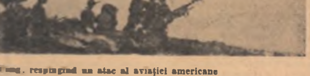
R. D. VIETNAM. — Apărătorii podului Nam Hung, respingînd un atac al aviației americane

Opunînd o rezistență hotărîtă agresorilor, forțele armate vietnameze au doborât numai în ultimele cinci luni peste 500 de avioane americane, care au violat spațiul aerian al R.D. Vietnam.