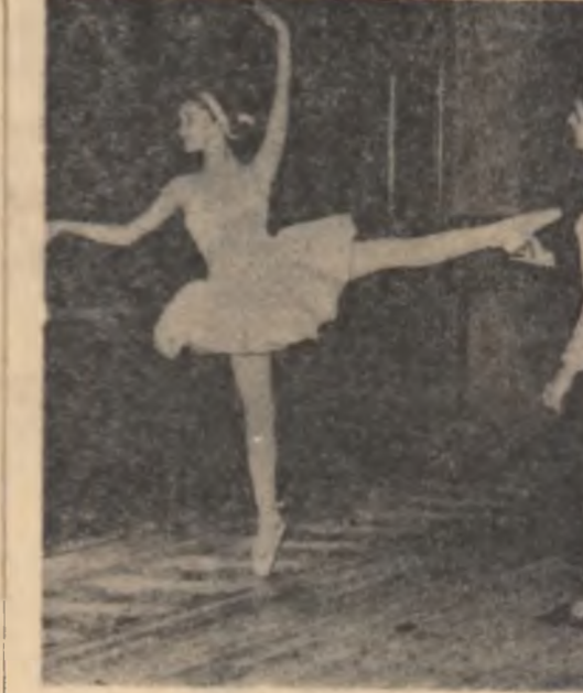
Pregătiri pentru viitoarele succese