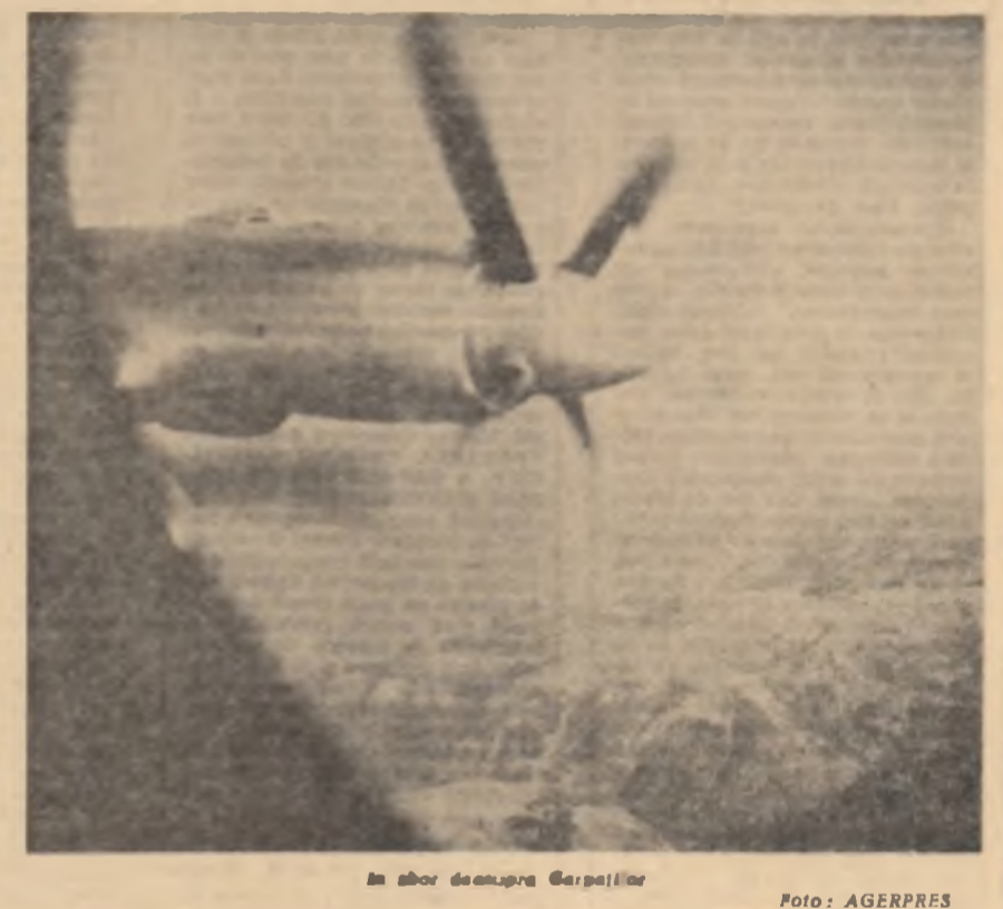
În zbor deasupra Carpaților

Unul din cele mai frumoase mituri ale antichității, povestit de Ovidiu în „Metamorfoze”, este mitul lui Phaeton, fiul lui Helios, zeul Soarelui. Cînd să conducă pentru o zi carul și călî înarpat al tatălui său, el nu l-a putut stăpîni și a aprins întreg Pămîntul. Cuprins de flăcări Pămîntul se usca, pterzîndu-și seva — cum spune poetul — și se desfacea în crăpături. Pierără mard orașe, iar pădurile arseră laolaltă cu munții... Pentru a pune capăt pierjului, Jupiter îl trîsni pe Phaeton pe maulu Eridanului, iar naiadele îngropară „al său trup încă fumegînd, mistuit de-ntrutele viruri de flăcări”. Heliadele, fiicele Soarelui, care plînsură și zi noapte pe nefericitul Phaeton, fură prefăcute în arbori, dar — mînuie! — nici atunci plînsul nu conținu. Lacrimii se scurg din nolle ramuri și acestea, în soare. Toate se fac chihlimbar: pe acesta-l ia-n lîmpede-a apă. Mitul lui Phaeton nu se înclintă azi numai prin neasemuita-i frumusețe poetică, ci și prin-fburele său științifice. Căci originea vegetală a chihlimbarului a fost confirmată