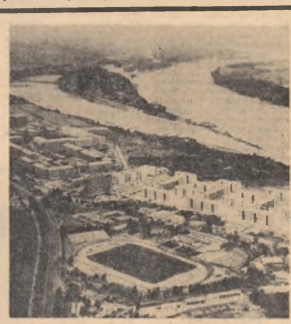
R. P. UNGARĂ. — Vedere panoramică din Dunajvaros

În primul act, pe scena dominată de aripa angliei a unui bombardier american stă reprezentate cu realism crud agresiunea Statelor Unite și urmările ei, în primul rând pentru cel cotropit. Nu s'au menajate însă nici suferințele, nici răsunerile agresorilor. În spectacolul de înfăptuire extrase din discursuri, comunicate oficiale, declarații, statistici. Există, de drept și un quaker care își dă foc ca un hoț pe scrierile Pentagonului și un tânăr american care nesocotește ordinul de mobilizare, dar există mai ales replici care pot fi considerate ca niște gloante: — Ucideti populația civilă, oameni nevoințari! — Bombardați cu sapalul! — Actul întâi se încheie prin sugerarea înfrângerii agresorilor, după care actorii, în loc să se retragă în culise, se împart în sălă.