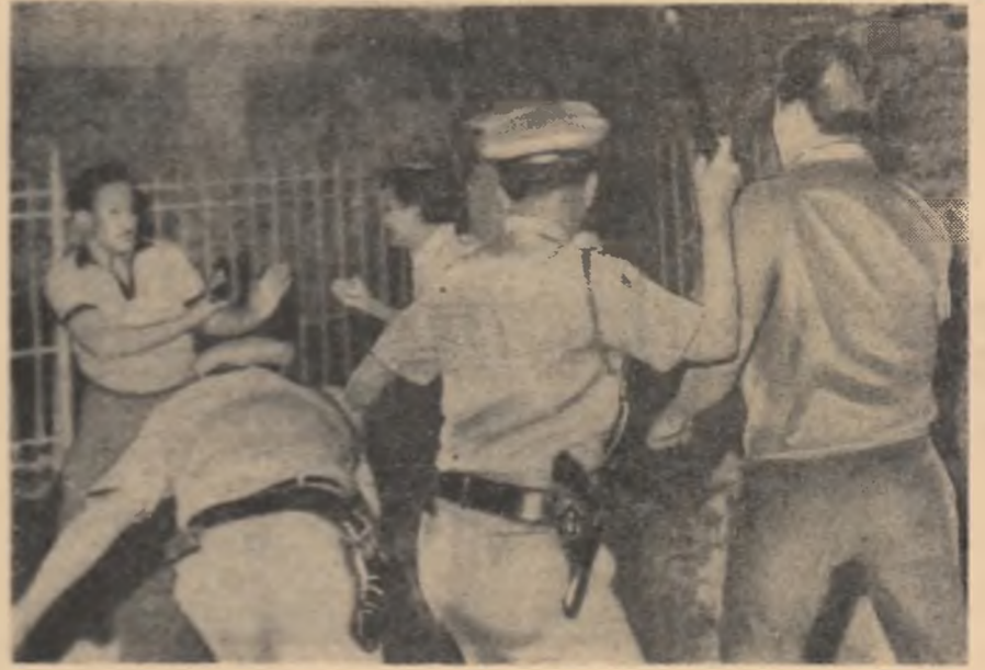
FILIPINE. — Tineri demonstranți alinați de poliție în timp ce protestanți în fața hotelului din Manila în care a locuit președintele Johnson, în timpul recentelor conferințe