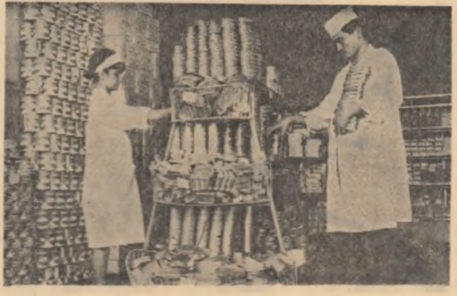
Bundăji necesare pentru căminul dumneavoastră pregătește și magazinul cu autoserviciu din Bulevardul 1848 nr. 44