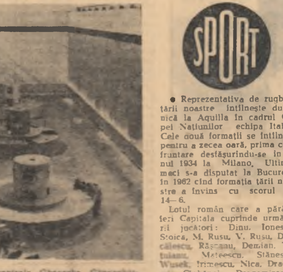
Uzina subterană de la Hidrocentrula „George Gheorghiu-Dej”, de pe Argeș, a cărei linie se vede în stânga.

baletetele „Lacul lebedelor”, „Emerald”, „Don Quijote”, „Gai-neh”, „Paquita”, precum și diverse piese coregrafice. La București, ansamblul din Kiev va evoluca pe scena Teatrului de Operă și Balet și în sala Palatului după care își va continua turneul la Brașov, unde va prezenta trei spectacole. La sediul Biroului Comercial de pe lângă ambasada R. P. Polone din București, s-a deschis vineri la amiază o expoziție de bunuri industriale de uz casnic, organizată de întreprinderea de comerț exterior „Universal” din Vargova. Expoziția rămânând deschisă până în ziua de 13 noiembrie a.c. La sediul Biroului Comercial de pe lângă ambasada R. P. Polone din București, s-a deschis vineri la amiază o expoziție de bunuri industriale de uz casnic, organizată de întreprinderea de comerț exterior „Universal” din Vargova. Expoziția rămânând deschisă până în ziua de 13 noiembrie a.c.