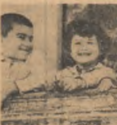
Poezie simplă și optimistă — zîmbetul candid și senin al copilăriei

plătră al Carpaților. Locul celor căzuți în încrîncenarea cu o amuzantă fatalitate căreia bogățiile și virtuțile locurilor și locuitorilor dădeau istoriei noastre valențe dramatice, au fost luate înzecit de urmași. Mama le-a dat viață, așa cum în cum-păsa luptelor mama le-a îmbărbătat inimile. În aburul de aur al legendelor descifrăm dramatismul și înaltul