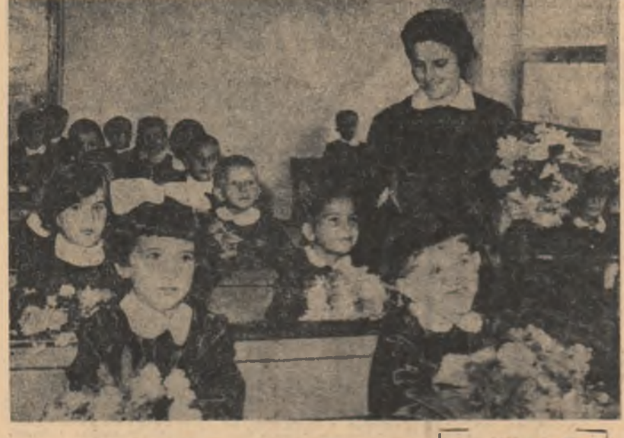
Prima zi din viața de elev (într-o școală din Tirana, capitala R. P. Albaniei)

Autoritățile din Nicaragua, sprînjind fătii „clanul Somoza” au luat recent noi măsuri menite a netezi drumul candidatului lor la scaunul prezidențial din Managua. În acest scop s-a folosit drept pretext incidentele care au avut loc în capitala Nicaragueli cu prilejul unei meci de baseball. După cum au anunțat agențiile de presă, în timpul meciului, cîteva sute de spectatori în majoritate studenți, sfîdînd prezența joi noaptea debaterii în Comitetul pentru problemele politice, economice și sociale și Comitetul pentru probleme administrative și financiare. Comitetul politic a examinat activitatea grupului țărilor africane la O.N.U. și a diferitelor comitete ale O.U.A., discriminarea rasială și politica de apartheid din R.S.A., precum și proiectul de rezoluție referitor la situația din coloniile portugheze din Africa. Au fost adoptate două rezoluții referitoare la Africa de sud-vest și la situația din Somalia franceză. Ministrul afacerilor externe al țărilor membre ale O.U.A. se spune în rezoluția cu privire la Africa de sud-vest, consideră că perspectiva dominației Republicii Sud-Africane asupra acestui teritoriu este echivalentă cu ocuparea militară ilegală a unui stat independent. Rezoluția cheamă toate țările membre ale O.U.A. să acorde ajuto-