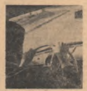
asigura pregătirea temeinică — din toate punctele de vedere — a conducătorilor de autovehicule?

Și, ca un corolar, apare întrebarea: așa cum este organizată în prezent școala de șoferi profesioniști, poate ea