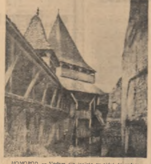
HOMOROD. — Vedere din interior de zidul de apărare