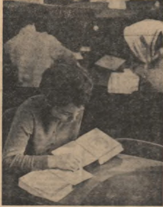
Nu, nu stătem în șanțuri; a o imagine strălucitoare din bibliotecă universitară. Studenții învață...