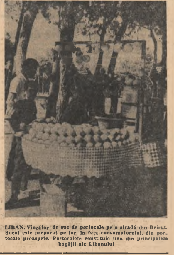
LIBAN. Vinzător de suc de portocale pe o stradă din Beirut. Sucul este preparat pe loc în fața consumatorului, din portocale proaspete. Portocalele constituie una din principalele bogății ale Libanului

Pe înaltul platou himalayan există un important zăcămint de fier, care nu a fost exploatat niciodată și care a fost pus în evidență de fotografiile în culori luate de cosmonautul Carpenter în cursul zborului său deasupra Asiei. S-a dovedit că și sateliții fără oameni la bord pot să aducă un sprijin prețios prospectării geologice și miniere.