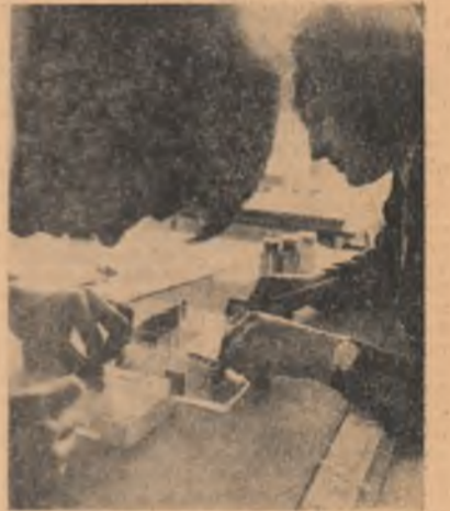
I.S.C.A.S. București - Aici capătă conturul inițial mii de apartamente