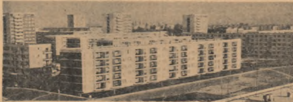
vedere de ansamblu a cartierului Țigăna II din Galați