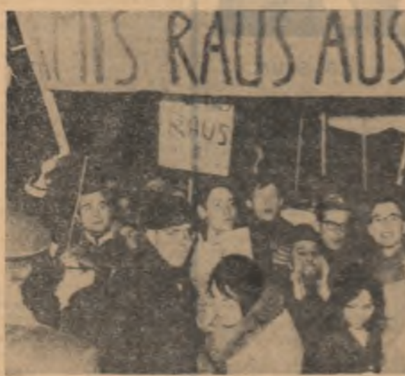
R. F. GERMANIA. — Recent la München a avut loc o demonstrație de protest împotriva politicii americane în Vietnam