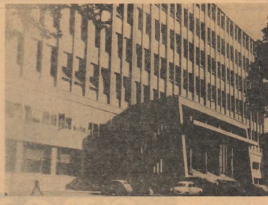
R. S. F. IUGOSLAVIA. — Noua clădire a Facultății de tehnologie din Ljubljana