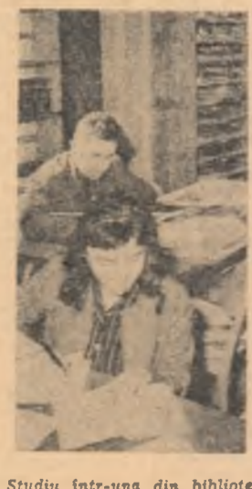
Studiu într-una din bibliotecile din Baia Mare