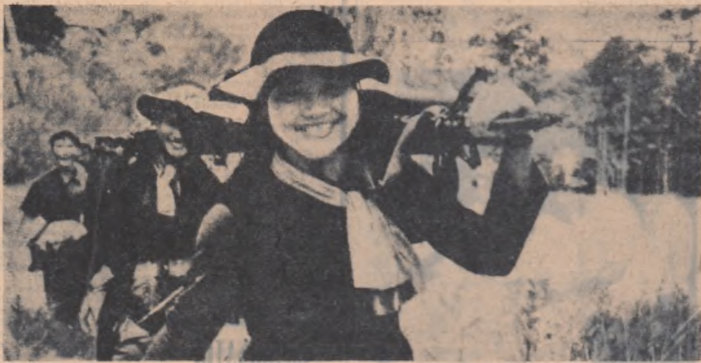
VIETNAMUL DE SUD. — Luptătorii ai armatei de eliberare întorcându-se victorioși dintr-o misiune

Actorul ajuns guvernator în California se răz bună. În zilele agitate ale campaniei electorale, Roland Reagan promise că „va face ordine” în Universitatea Berkeley. Preocupările lui universitare ar putea stârni mirare. Însă Berkeley are o rezonanță deosebită. Atmosfera din acest oraș zămint de învățământ superior neliniștește pe politicienii conservatori, căci studenții universității manifestă o remarcabilă independență în comentarea politicii Washingtonului în Vietnam, pe care o condamnă ca fiind nerecistă și primejdioasă pentru pacea lumii. De altfel, și în problema discriminării rasiale au o altă poziție decât cea a factorilor de guvernământ. Pentru „vinătorii de vrăjtoare” Berkeley a devenit „un centru al subversivității. Amenințările repetate la adresa studenților doritori să-și exprime nesimțirile față de răz bună au avut efectul scontat. Tinerii de la Berkeley au rămas la fel de curajoși. Domnul Reagan a promis, însă, „răz bună”. Studenții s-au văzut pe depeșiți. Guvernatorul a stabilit o taxă de înscriere în Universitate care se ridică la suma de 400 dolari. Reagan speră, astfel, să îndepărteze din amfiteatru pe studenții cu venituri mai mici și care în general, pot fi înfrunți în rândul manifestanților. Cei care cunosc climatul politicii de la Berkeley știu că guvernatorul și-a greșit socoteliile. Studenții par hotărâți să continue lupta pe care au început-o pentru victoria adevărată și dreptății. P. NICOARĂ