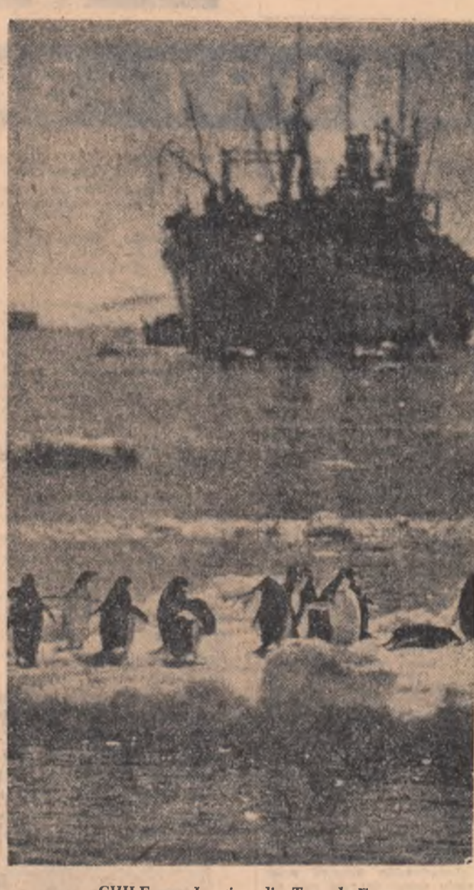
CHILE. — Imagine din Țara de Foc