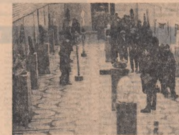
Expoziția sculpturii Dumitru Căileanu, deschisă în noua sală din Piața Unirii-Iași