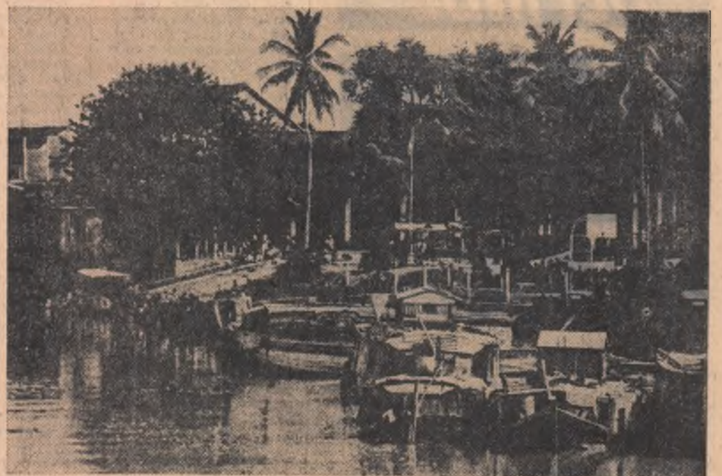
Sat cambodgian pe malul rîului Campong-Teabel