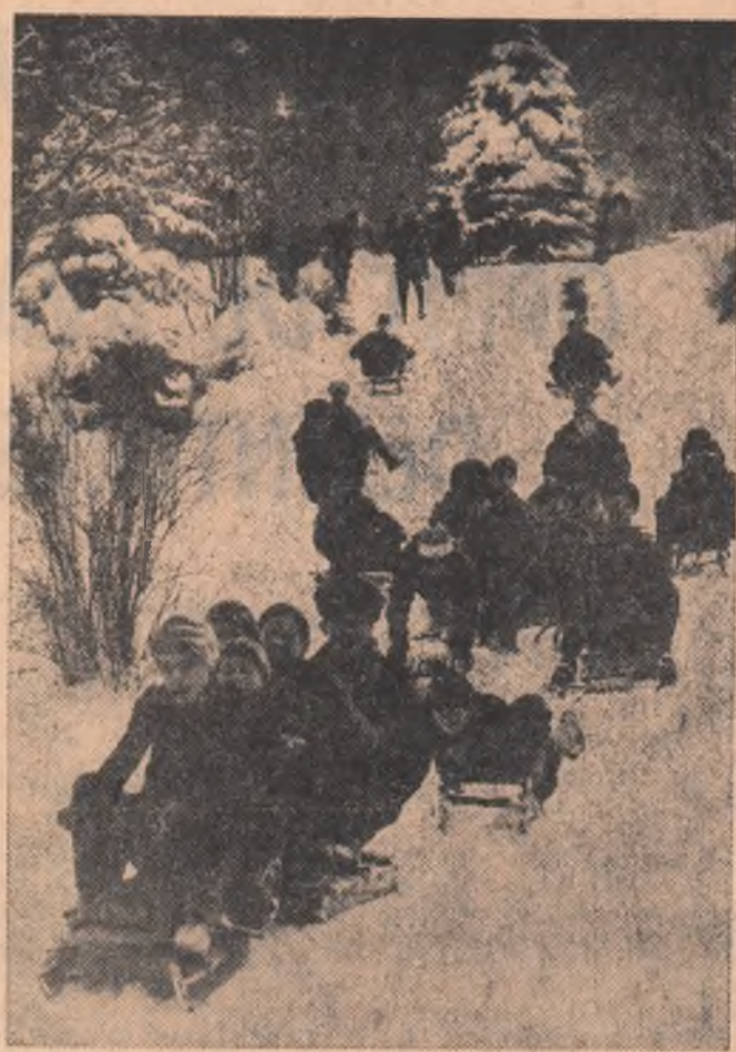
R. P. BULGARIA. — Săniș în Parcul libertății din Sofia

Pe de altă parte, cei doi miniștri, au făcut un schimb aprofundat de vederi cu privire la evoluția relațiilor dintre cele două țări și au constatat cu sa-