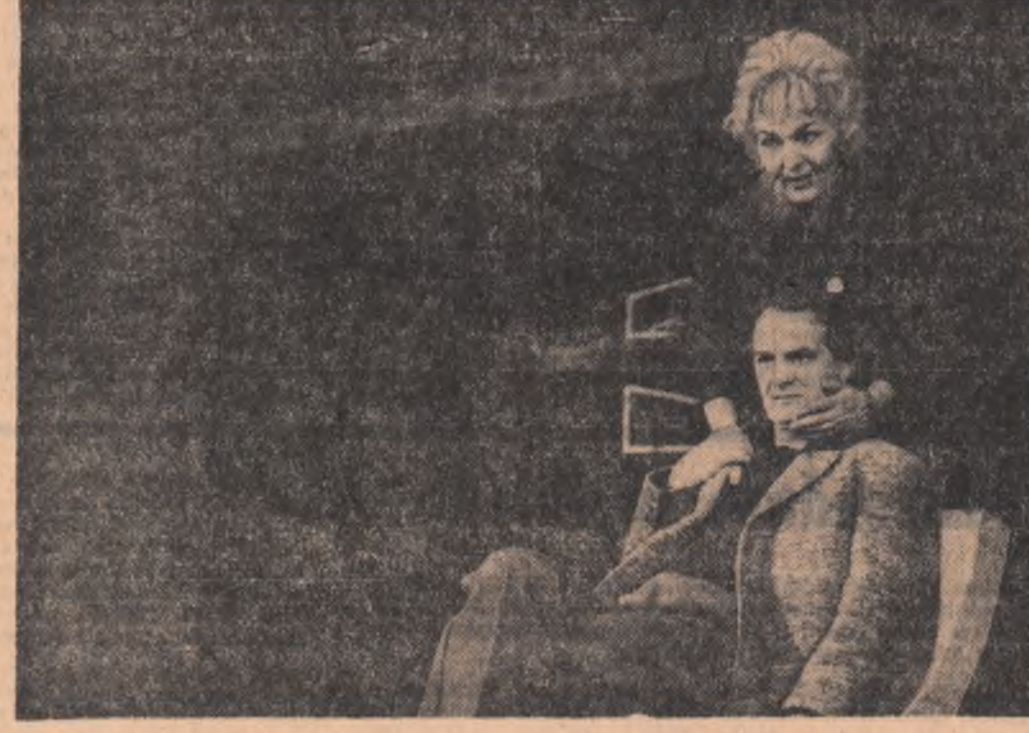
Teatrul de Stat din Sibiu pregătește viitoarea premieră cu piesa „Moartea unui artist”

● Știri interviuri reportaje ● Știri interviuri reportaje ● Știri interviuri reportaje ● Știri interviuri reportaje