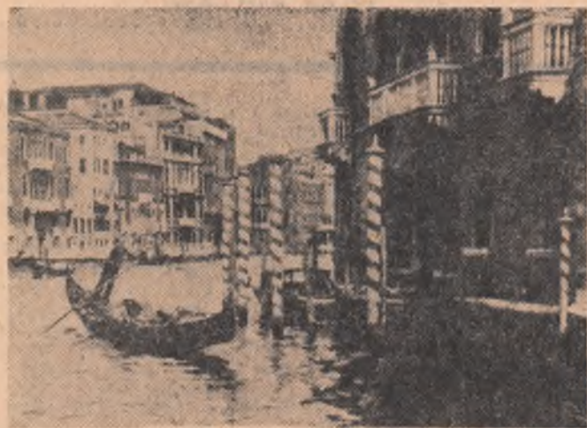
Pe unul din Canalele Veneției

Președintele Columbiei, Carlos Lleras Restrepo, a declarat joi seara stare de urgență după catastrofalul cutremur de pământ ce a avut loc în aceeași zi în țară. Mișcările seismice care au fost resimțite de două ori, în decurs de șase ore, au provocat, potrivit unor evaluări provizorii, moartea a 84 de persoane, rănirea a peste 300 și uriașe pagube materiale. Epicentrul cutremurului se află în departamentul Huila, la 290 km sud de Bogota, de-a lungul lanțului Anzilor Centrali. În acest departament, 60 de persoane au fost ucise. Numeroase clădiri s-au prăbușit în orașele: Cali, Pereira, Medellín, Bucaramanga. În capitala țării, s-au înregistrat 12 morți.