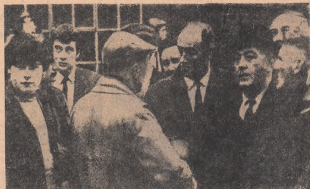
Grup de muncitori constructori greviști din Londra exprimându-și hotărârea de a continua greva, în fața reprezentanților companiei de construcții.

Din partea polonă, la întâlnire au participat: Jozef Cyrankiewicz, membru al Biroului Politic al C.C. al P.M.U.P., președintele Consiliului de Miniștri, Zenon Kliszko, membru al Biroului Politic, secretar al C.C. al P.M.U.P.