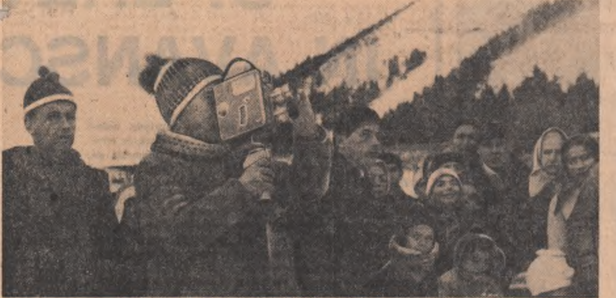
Atențiune filmăm!... Încă puțin și jurnalul de actualități va fi gata