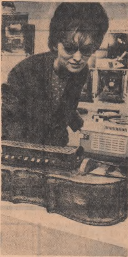
Muzeul politehnic Iași. Colecția de aparate pentru redat sunetul