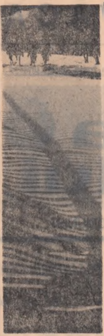
Muntence la Cimpul lui Neag.

Putem noi să-i prezentăm așa cum face Dashiell Hammett, ca pe niște funcționari plătiți? În altă ordine de idei cred că numai în cărțile slabe detectivii sînt prezentați ca oameni perfecți. În cărțile bune ei nu știu totul de la început, pun ipoteze, verifică piste, le abandonează fiindcă sînt greșite și abia la sfîrșit datorită nu exclusiv unor calități deosebite, ci a unei munci colective izbutesc să facă înofensiv pe infractor. Există, ce e drept, o defecțiune