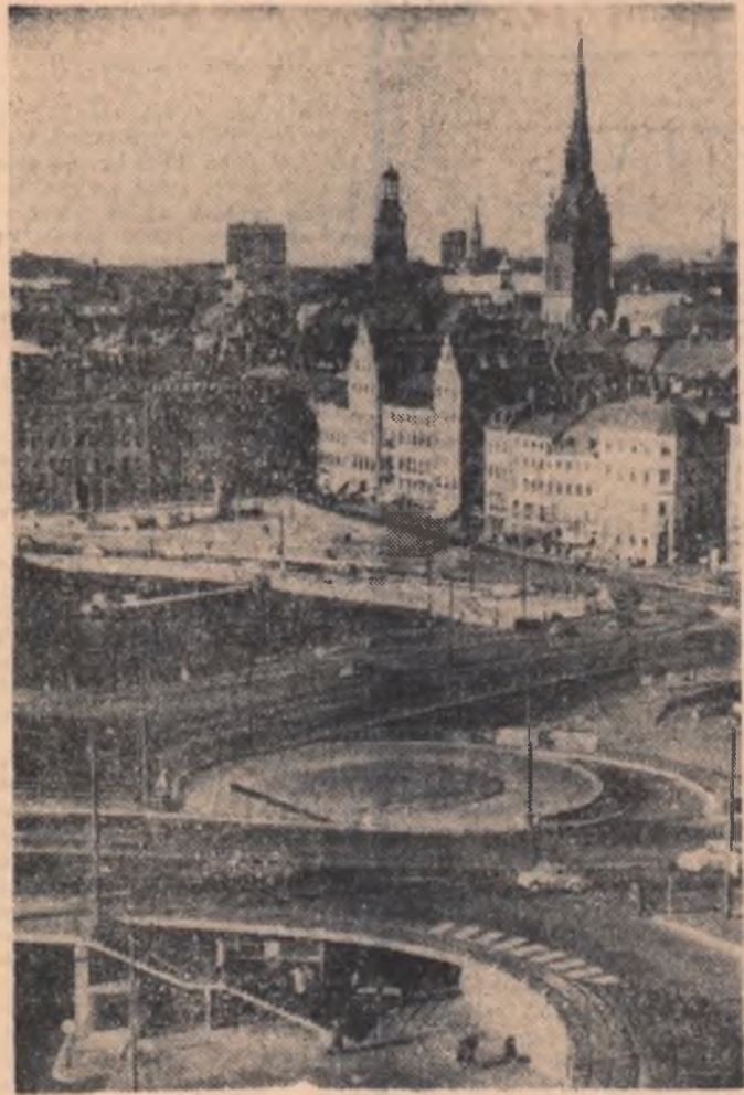
SUEDIA. — Imagine din centrul Stockholmului

stații-pilot în domeniul petrochimiei. După-amiază a fost vizitată cunoscuta societate Pirelli din Milano, în ale cărei uzine lucrează peste 85.000 de salariați. Aici se produc cauciucuri pentru autovehicule, cabluri electrice și diferite articole tehnice din cauciuc. Emanuele Dubini, administrator delegat al societății — președintele asociației industriștilor din Liguria — a informat pe oaspeți despre activitatea societății atât în Italia, cât și peste hotare, despre relațiile ei cu diferite întreprinderi din România. Președintele Comitetului de Stat al Planificării, Maxim Berghianu, din cursul invitației președintelui Institutului de Studii pentru Politica Internațională din Milano (I.S.P.I.), a prezentat la sediul acestui institut expunerea „Economia Republicii Socialiste România și perspectivele ei de dezvoltare, relațiile economice externe ale României”. Au fost de față prefectul orașului Milano, oameni de afaceri, reprezentanți ai Camerei de comerț, reprezentanți consulari și ziaristi din acest important centru industrial al Italiei.