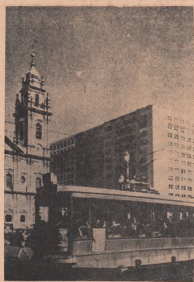
BRAZILIA. Vedere din Rio de Janeiro