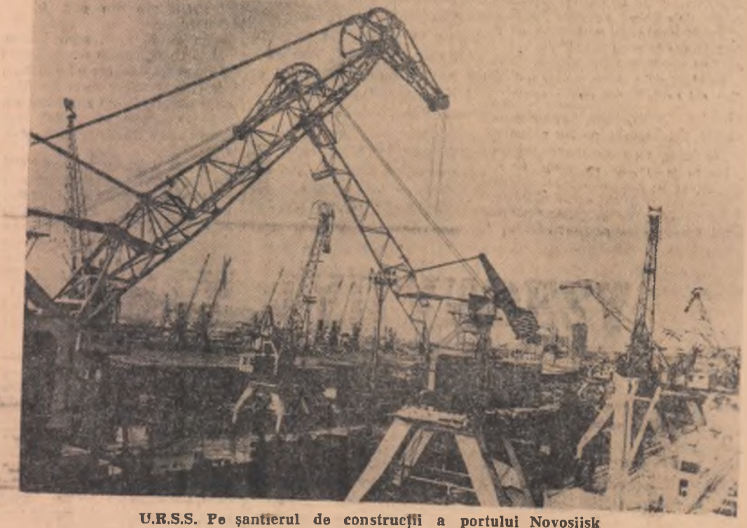
U.R.S.S. Pe șantierul de construcții a portului Novosisk

Presupunînd existența atmosferei compusă din metan și amoniac pe toate planetele și a existenței altor sisteme solare, se apreciază că viața nu ar exista numai pe Pămînt, ci și pe alte planete.