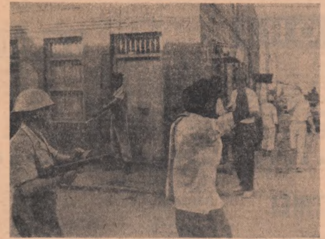
In Aden, atmosfera se menține incordată. În fotografie: Arestări pe străzile orașului Aden

Climatul cald și secetos al Egiptului a făcut ca monumentele milenare să se păstreze într-o stare perfectă. Nu același lucru se întîmplă însă cu monumentele Europene. Statuile Veneției se degradează sub efectul ploii și al gazelor de eșapament. Forumul Romei suferă rigidurile unor ierni mai aspre. Catedralele din Strassbourg sau Paris, Turnul din Pisa, monumentele Florenței cunosc la rîndul lor aspecte mai mult sau mai puțin