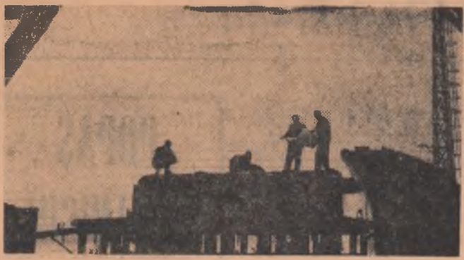
Santierul naval Galați