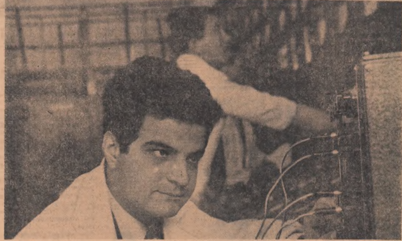
În laboratorul „centrale și sisteme electrice” al Institutului Politehnic „Gh. Gheorghiu-Dej” din Capitală