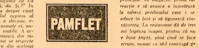
Figura lui mă îndepărtează încă dinaintea a-mi apară dinaintea ochilor. Mi-l imaginez zâmbind și încerc să-l îndepărtez ca pe o obiect...