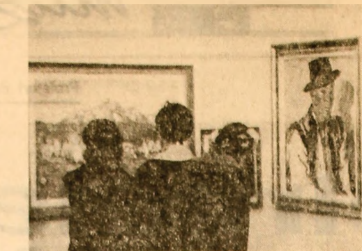
Elevi de la Liceul Pedagogic din Bacău în vizită la muzeul regional care aniversază un deceniu de existență.

Cochetăria la acest mod cu lumea adolescenței nu poate salva cartea de mediocritate. Dimplovă și în această se întimplă și în „STRIGĂTUL” lui Corneliu