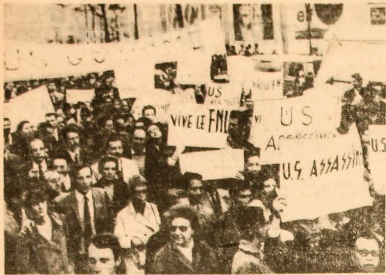
Aspect din timpul unei demonstrații de la Paris împotriva bombardamentelor americane asupra R. D. Vietnam