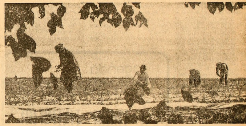
Gospodăria agricolă de stat Domnești are un profil legumicol. Anual, unitatea agricolă produce pentru piața Capitalei și pentru export peste 4.600 t legume. Fotografia redă un aspect din timpul executării copilului roșilor timpurii protejate cu folie de polietilenă.

zeze fire extra fine din bumbac și în amestec cu fibre poliesterice. Capacitatea anuală a filaturii — 3.600 tone fire cardate și 3.800 tone fire pieptănate, va fi realizată începînd din cea de a doua jumătate a anului viitor. (Agerpres).