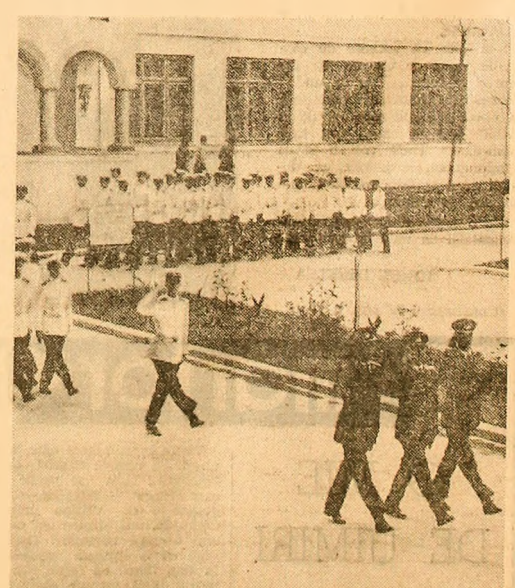
În rânduri compacte, pe clase, cu pas cadențat, defilează, în frunte cu comandanții lor bacalaurii cantemiriști...