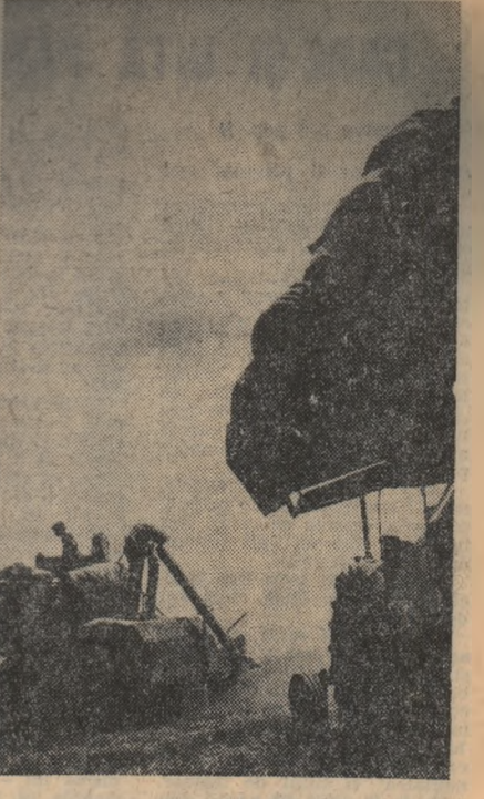
Numai după un drum în lan...

să se denumit astfel). Examenul de stat la aceste institute, care nu au decît o scolarizare de 3 ani, se deosebește de cele de la institutele de învățămînt superior prin aceea că nu se cere candidatul să elaboreze o lucrare pe care s-o susțină apoi în fața comisiilor. Examenul se compune din probe scrise și orale la câteva din materiile predate în cursul celor trei ani de scolarizare. Așa, de exemplu, la facultățile de fizică și chimie se dau două probe scrise, la fizică și chimie, precum și probe orale la fizică, chimie, pedagogie, socialism. Deși în cei trei ani studenții au învățat la fizică: mecanică, teoria cinetică-moleculară și căldură, electricitate și electrotehnică, electronică, optică și spectroscopie și