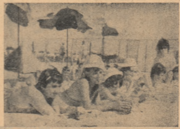
Pe plajă — în așteptarea „bronzului” solar

ION GHEORGHE MAURER Președintele Consiliului de Miniștri al Republicii Socialiste România