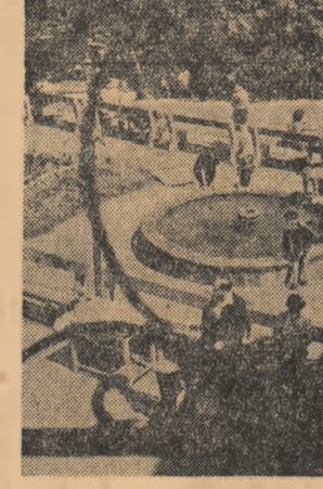
În parc la Borsec

În primul rînd necesitatea folosirii de către combinele a întregii zile de lucru. La Cheșea și în alte cooperative am observat tendința de „defectare” a combineelor în jurul orelor 18-18,30 cînd soarele este încă sus, și se mai poate lucra. Brigadierii, președinții și inginerii din cooperative agricole ar trebui să-și ajute mai mult pe mecanizatorii pentru a reduce cît mai mult posibil întoarcerile și deplasările mari, inutile, cu combinele, timpul de descărcare al sacilor. Viteza de lucru a combineelor, sporirea productivității lor și reducerea defecturilor în brazdă, sînt condiționate și de numărul de coșești pe care îi vor antrena cooperativele la tăierea vetrelor intens îmburuienate, de operativitatea cu care se face transportul recoltei.