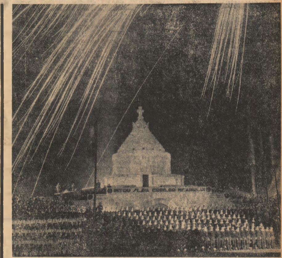
Finalul impresionantului spectacol de evocare a luptelor strămoșesti

Să nu uităm nicodată că toate cuceririle de care ne bucurăm azi au fost obținute prin jertfa celor mai buni fii ai poporului nostru. În fața memoriei celor care au căzut în lupta pentru dreptate socială și națională să ne legăm de a face totul pentru a asigura progresul neînterupt al țării, bunăstarea și fericirea întregului popor, să ne legăm de a face să strălucească tot mai puternic în lume gloria pașnică a poporului român, pregătirea și echiparea corespunzătoare a forțelor noastre armate, întă-