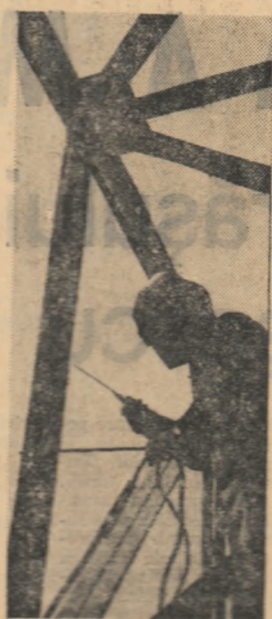
Uzina de aluminiu Oradea. Fază de lucru la extinderea întreprinderii